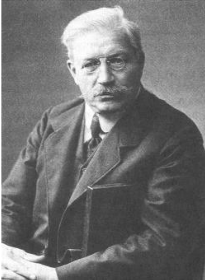
П. Н. Миллюков «Дарданнелский»