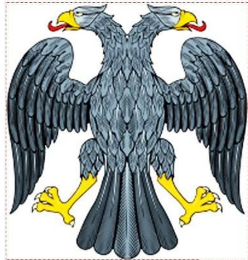
Герб России при Временном правительстве. 1917. год.