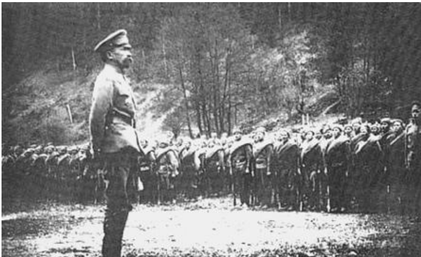
Генерал Л.Г. Корнилов перед войсками Ю-З фронта