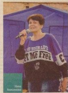
Ребята на очной встрече волонтеров ДС «Борисоглебский»