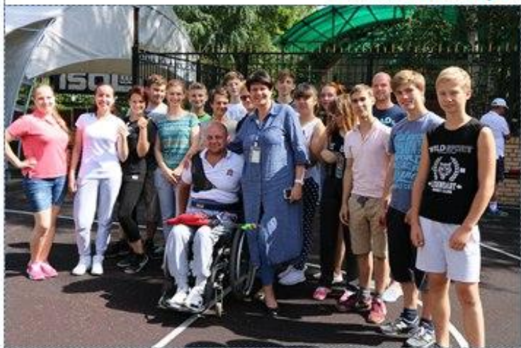
Активисты школы волонтеров с членом сборной Московской области по стрельбе из лука