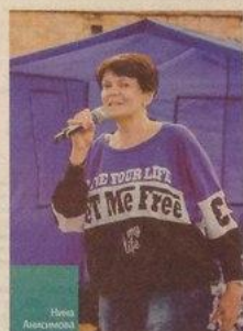
Ребята на очном собрании волонтеров ДС «Борисоглебский»