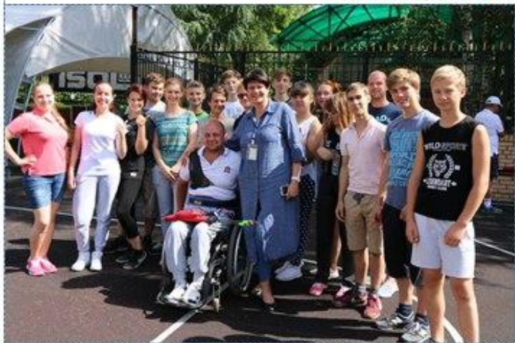
Активисты школы волонтеров с членом сборной Московской области по стрельбе из лука