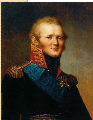
Император Александр I (1801 – 1825)

Обстоятельства, сопровождавшие детство и юность Александра I, значительно повлияли на его личность и характер, ставший двойственным.