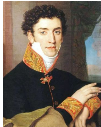
Граф Н.Н. Новосильцев