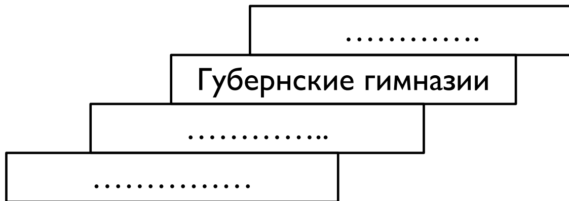
Схема: Система образования России в первой четверти XIX в.

Задание: Заполните в схеме пропуски и рядом с названием учебного заведения укажите, выходцы из каких сословий могли в нем обучаться.