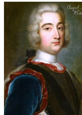
Князь А.А. Чарторыйский