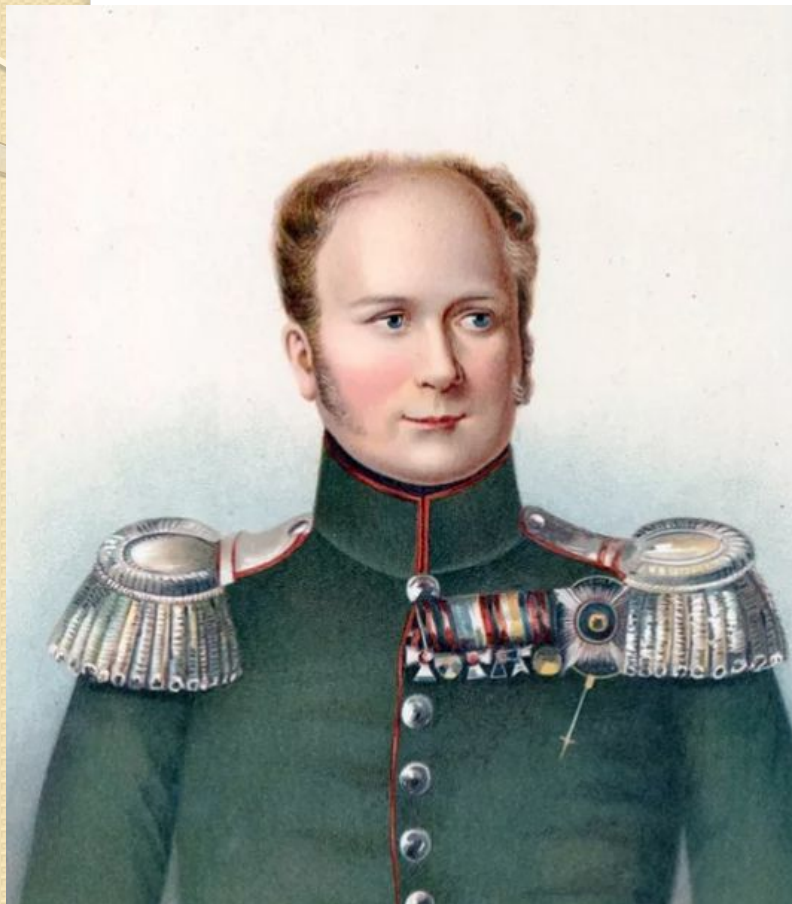
Император Александр I Годы правления: 1801 – 1825 гг.

В 1801 г., став императором в возрасте 24 лет, в манифесте о восшествии на престол Александр I обещал управлять «по законам и по сердцу бабки своей – Екатерины Великой».