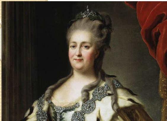
Бабушка – императрица Екатерина II Великая (1762 – 1796)

Просвещённый абсолютизм; забота о хорошем образовании внука