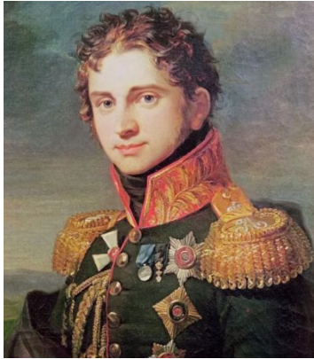
Граф П.А. Строганов