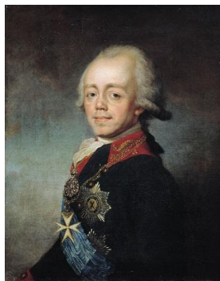
Отец – император Павел I (1796 – 1801)