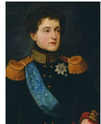
Граф В.П. Кочубей