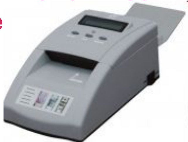
PRO 310 A MULTI