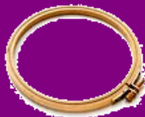
деревянные пяльцы с металлическим винтом