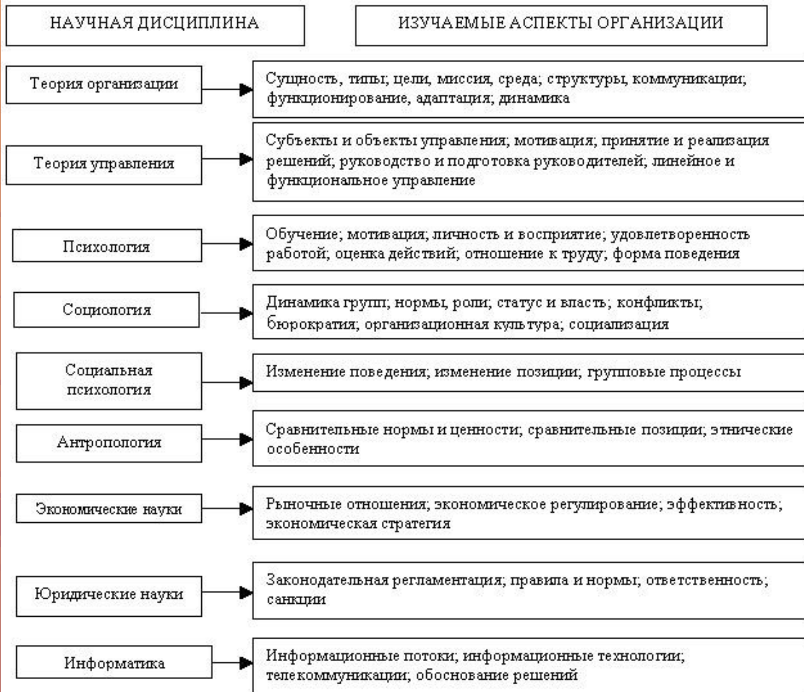
Рис. 1. Система наук об организации