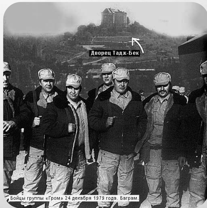
Бойцы группы «Гром» 24 декабря 1979 года. Баграм.

«МУСУЛЬМАНСКИМ» БАТАЛЬОНОМ И СПЕЦГРУППАМИ КГБ НАЧАТА ОПЕРАЦИЯ ПО ЗАХВАТУ РЕЗИДЕНЦИИ АМИНА – ДВОРЦА ТАДЖ-БЕК. В ХОДЕ ШТУРМА ДВОРЦА АМИН, ДО ПОСЛЕДНЕГО МОМЕНТА НЕ ПОДОЗРЕВАВШИЙ, ЧТО ВЫЧЕРКНУТ ИЗ ПЛАНОВ СОВЕТСКОГО РУКОВОДСТВА БЫЛ УБИТ. НОВЫМ РУКОВОДИТЕЛЕМ ДРА СТАЛ Б. КАРМАЛЬ.