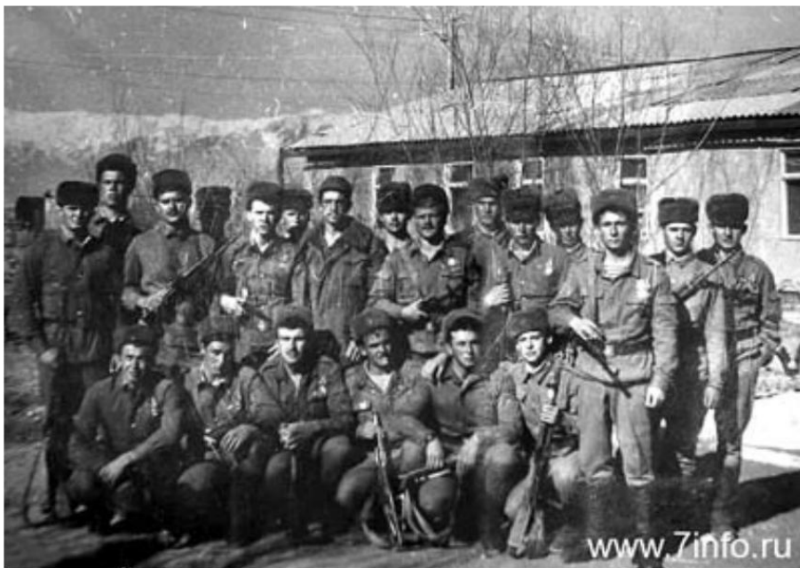
9-я Рота. Афганистан 1989

4 ФЕВРАЛЯ — ПОСЛЕДНЕЕ ПОДРАЗДЕЛЕНИЕ СОВЕТСКОЙ АРМИИ