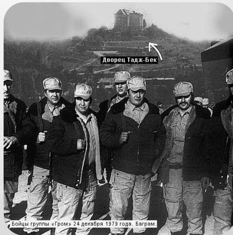
Бойцы группы «Гром» 24 декабря 1979 года. Баграм.

«МУСУЛЬМАНСКИМ» БАТАЛЬОНОМ И СПЕЦГРУППАМИ КГБ НАЧАТА ОПЕРАЦИЯ ПО ЗАХВАТУ РЕЗИДЕНЦИИ АМИНА – ДВОРЦА ТАДЖ-БЕК. В ХОДЕ ШТУРМА ДВОРЦА АМИН, ДО ПОСЛЕДНЕГО МОМЕНТА НЕ ПОДОЗРЕВАВШИЙ, ЧТО ВЫЧЕРКНУТ ИЗ ПЛАНОВ СОВЕТСКОГО РУКОВОДСТВА БЫЛ УБИТ. НОВЫМ РУКОВОДИТЕЛЕМ ДРА СТАЛ Б. КАРМАЛЬ.