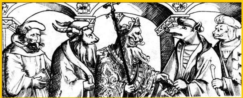
Папа Римский и богословы

Церковь стала крупным феодалом. Стремясь обогатиться любым способом, она кроме десятины получала до-ходы от дорогих обря-дов и от продажи ин-дульгенций . За самые тяжкие грехи можно было получить прощение, заплатив несколько золотых монет.