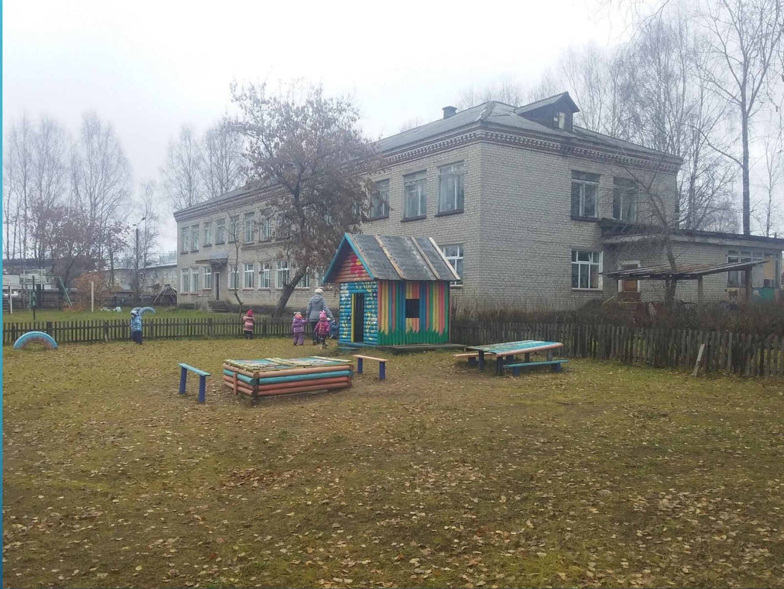
ДЕТСКИЙ САД «СОЛНЫШКО»