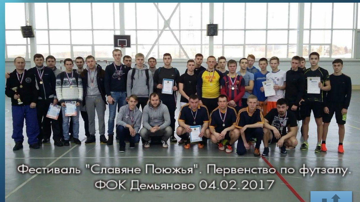
Фестиваль "Славяне Поюжья". Первенство по футзалу. ФОК Демьяново 04.02.2017

АДРЕС: пгт Демьяново ул. Энергетиков, 3в ТЕЛ.: 89229518899