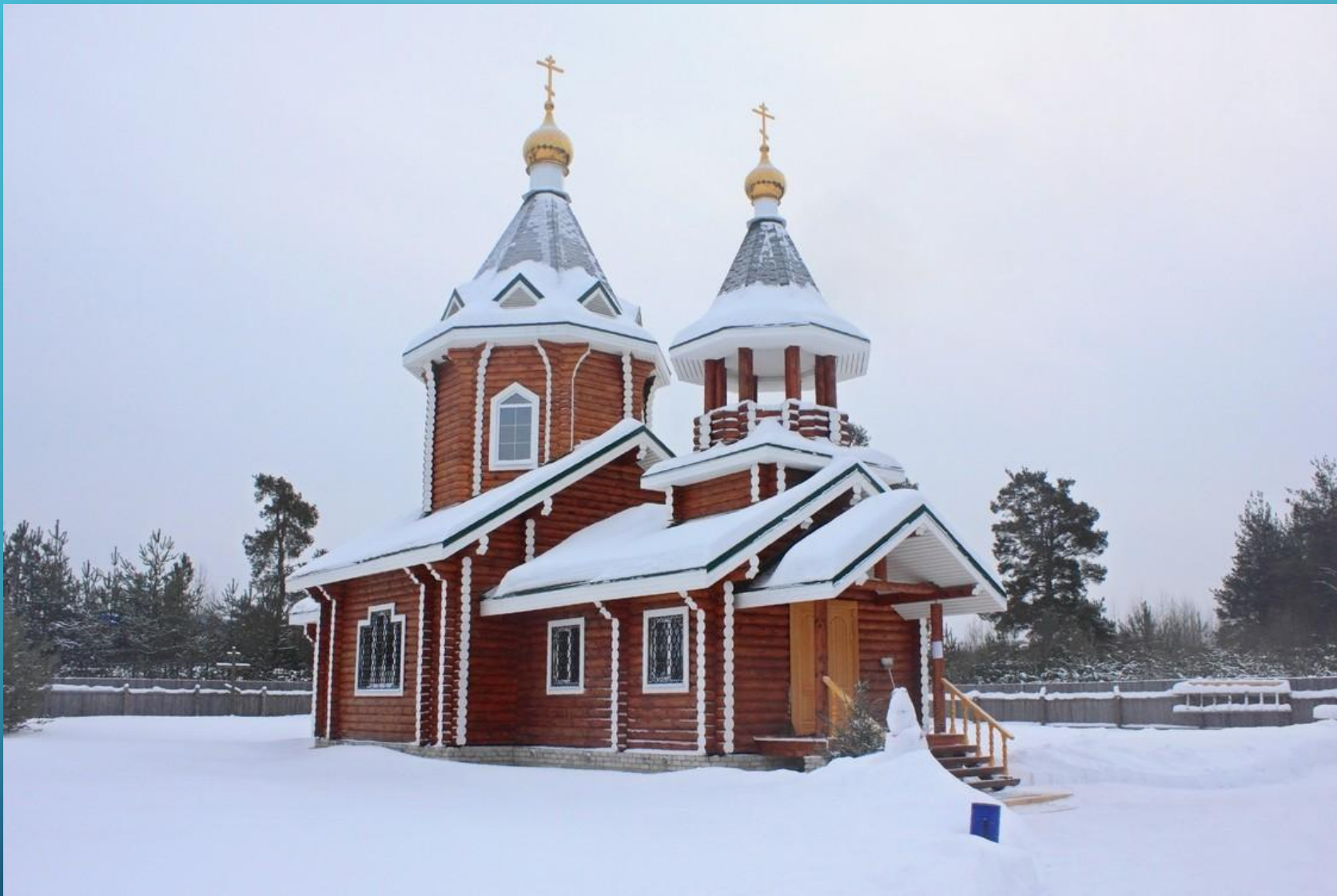
ХРАМ ПРЕПОДОБНОГО СЕРГИЯ РАДОНЕЖСКОГО