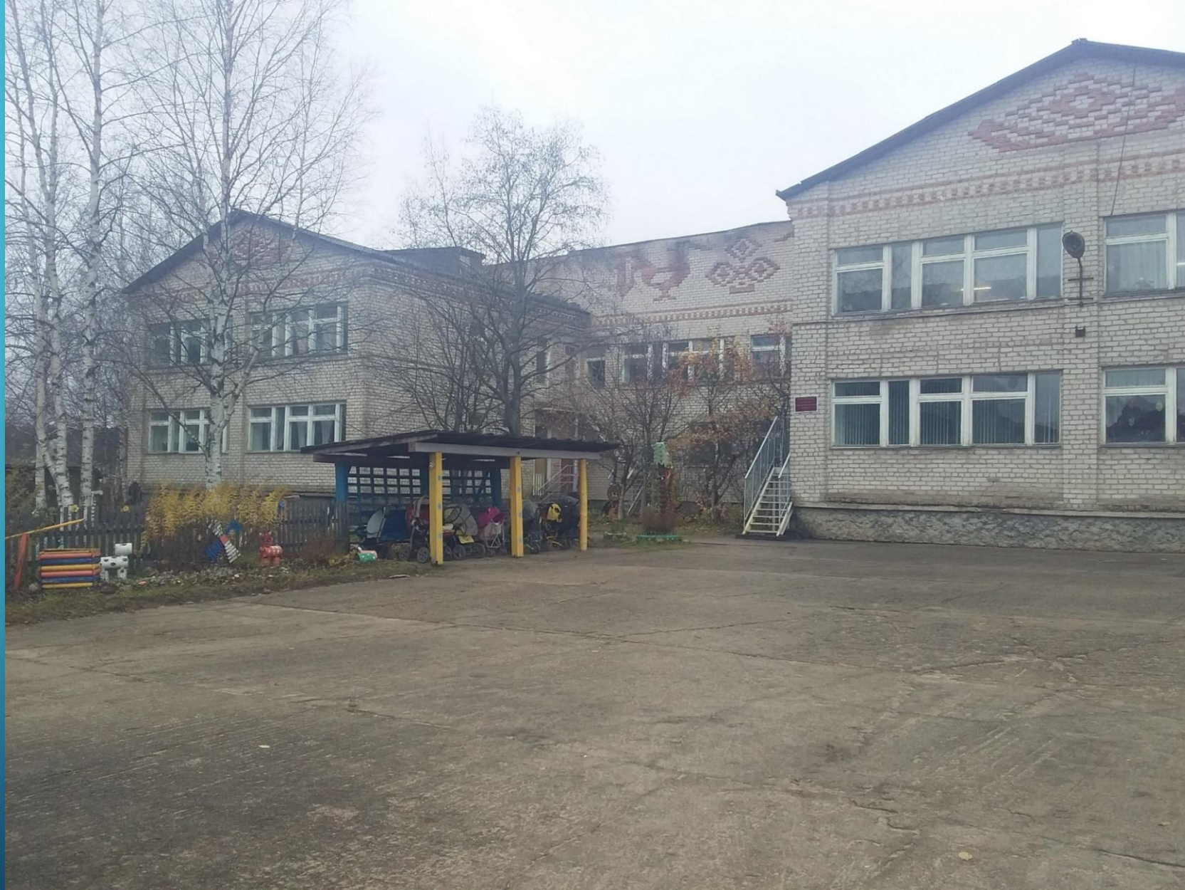
ДЕТСКИЙ САД «СКАЗКА»