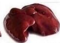
Печень говяжья 18г