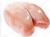
Филе куриное 21г