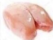
Филе куриное 21г