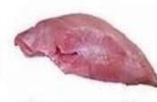
Филе индейки 23г