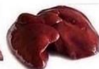
Печень говяжья 18г