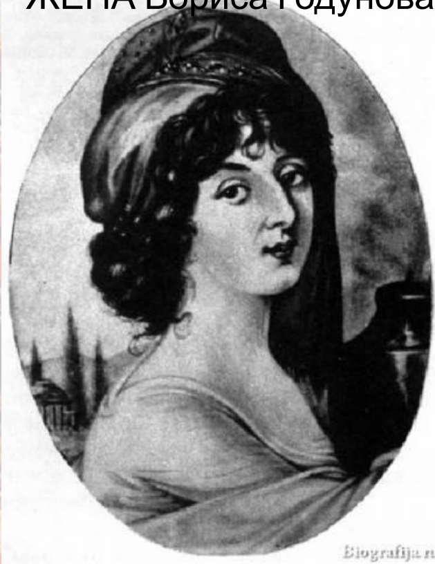
ЖЕНА Бориса Годунова

В апреле 1605 г. царь Борис неожиданно умер, войска перешли на сторону "Дмитрия" и в июне Москва с торжеством приняла "природного" государя (1605–1606 гг.) Жена и сын Бориса Годунова были убиты до прихода в Москву Лжедмитрия.