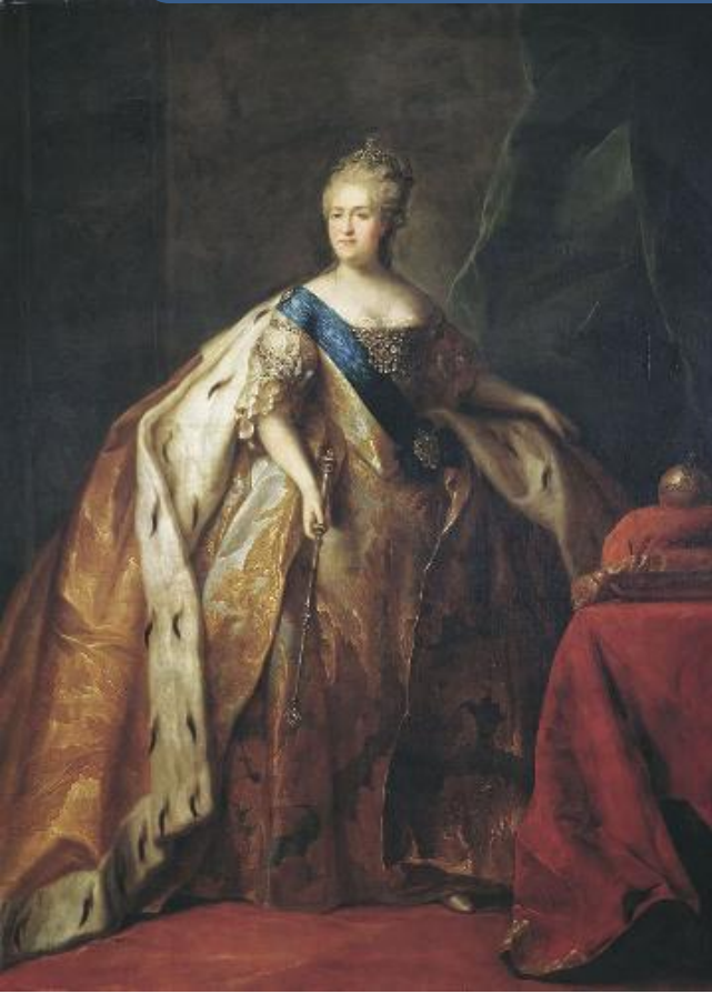
Портрет императрицы Екатерины II. Худ. П.С. Дрожжин. 1796 г.

Для разработки Уложения Екатерина в 1767 г. созвала Уложенную комиссию . Предварительно она подготовила «Наказ» депутатам, над которым работала в течение 1764–1766 гг.