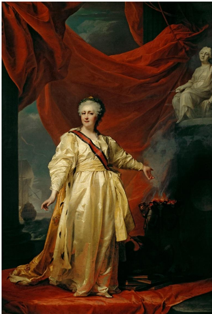
Левицкий Д. Г. Екатерина II – законодательница в храме богини Правосудия. 1783

«Просвещённый абсолютизм» – политика ряда абсолютистских государств Европы в сер. и 2-й пол. XVIII в., характеризующаяся следующими признаками: