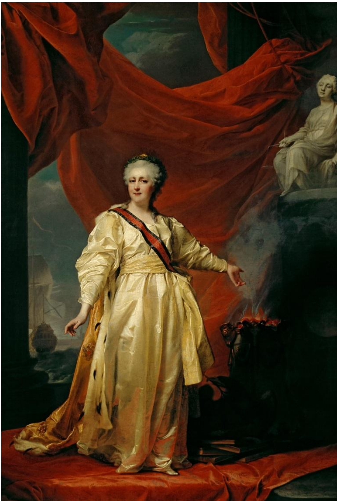
Левицкий Д. Г. Екатерина II – законодательница в храме богини Правосудия. 1783

«Просвещённый абсолютизм» – политика ряда абсолютистских государств Европы в сер. и 2-й пол. XVIII в., характеризующаяся следующими признаками: