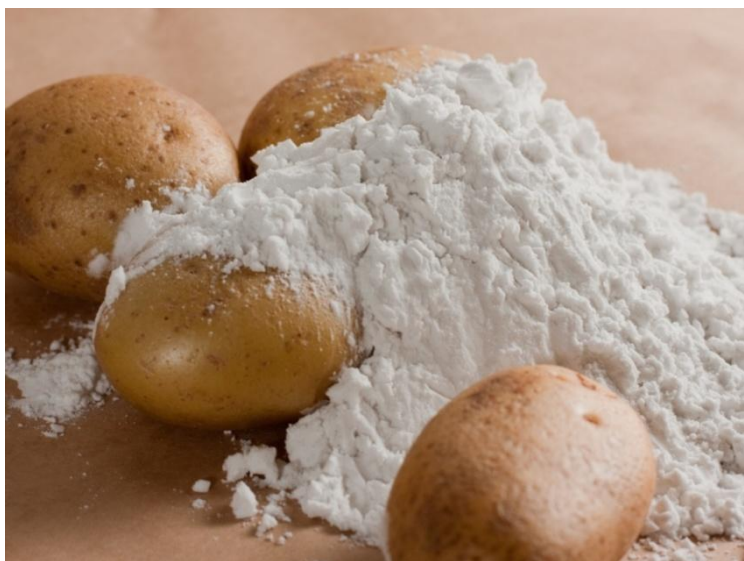
Крахмал в природе