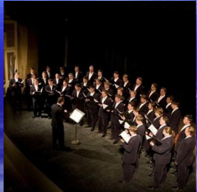
Мужской хор Московского Сретенского монастыря