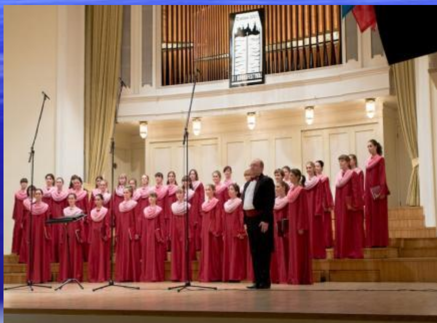
Женский хор Смоляного собора