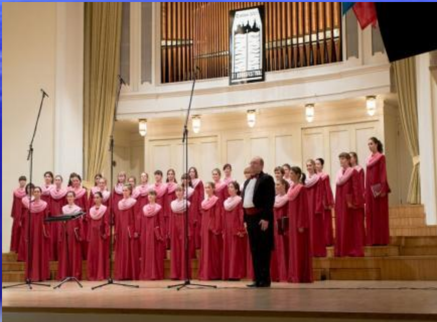
Женский хор Смоляного собора