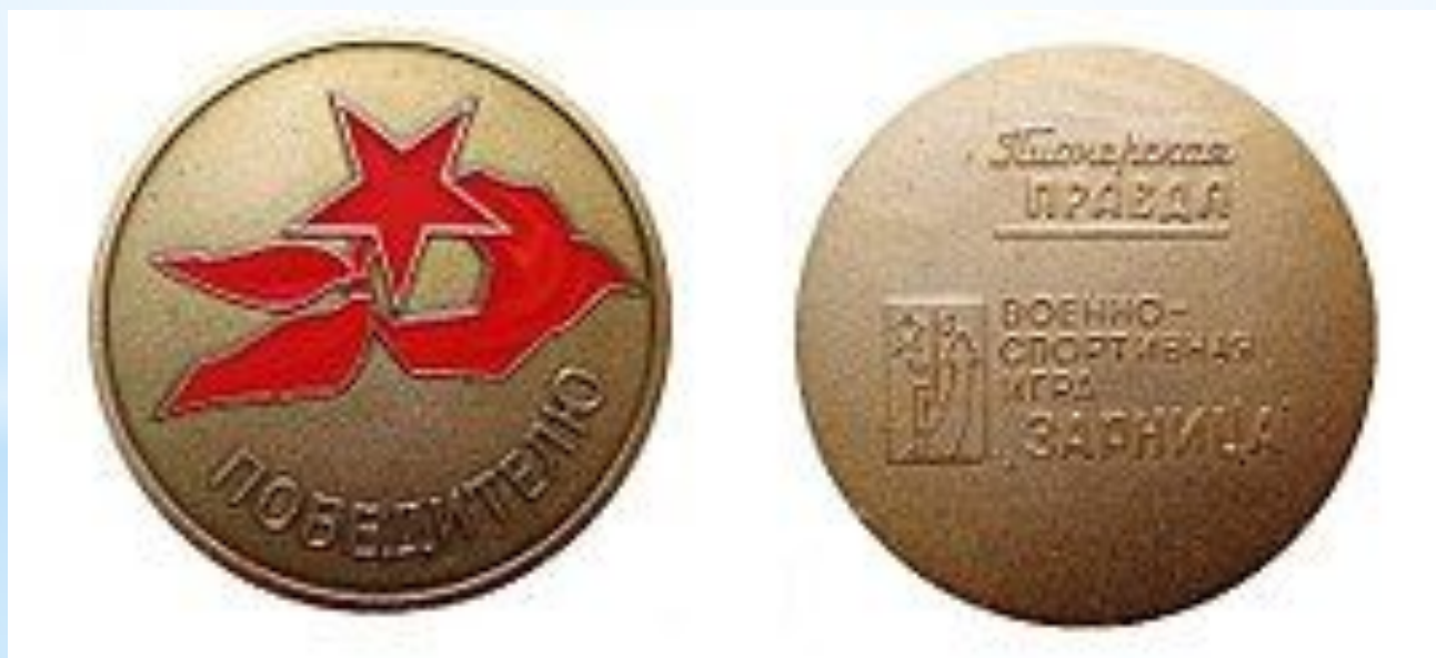
Медаль победителю военно-спортивной игры «Зарница» на приз газеты «Пионерская правда»

Своим приказом маршал поставил задачу создать юнармейские батальоны, обучить молодёжь навыкам армейской жизни, а также воспитывать её в духе любви к Родине и готовности противостоять любым врагам.