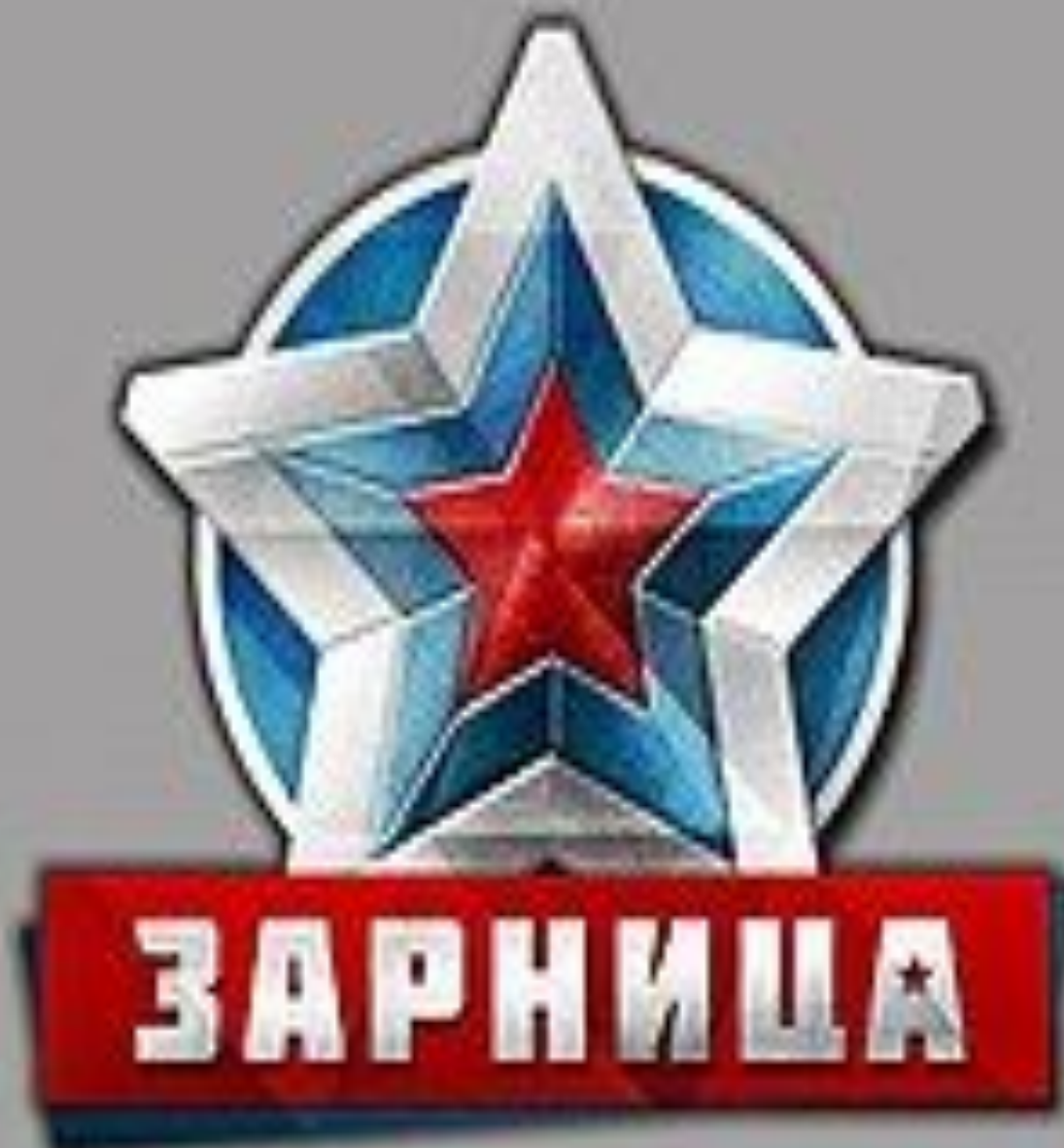
Эмблема всероссийской игры «Зарница»