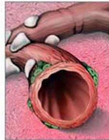
Нормально функционирующие бронхи