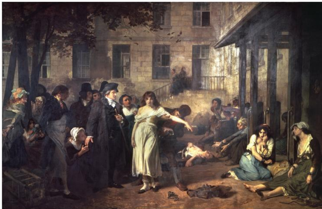
Филипп Пинель освобождает душевнобольных от цепей в больнице Сальпетриер в Париже в 1795 году