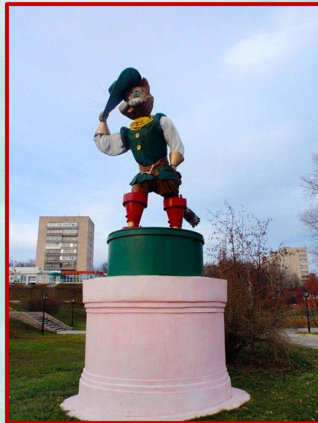
В городе Сумы на Украине в Парке «Сказка»