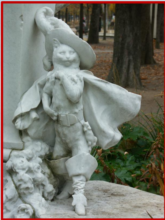
Фрагмент памятника Шарлю Перро в Тюильрийском саду