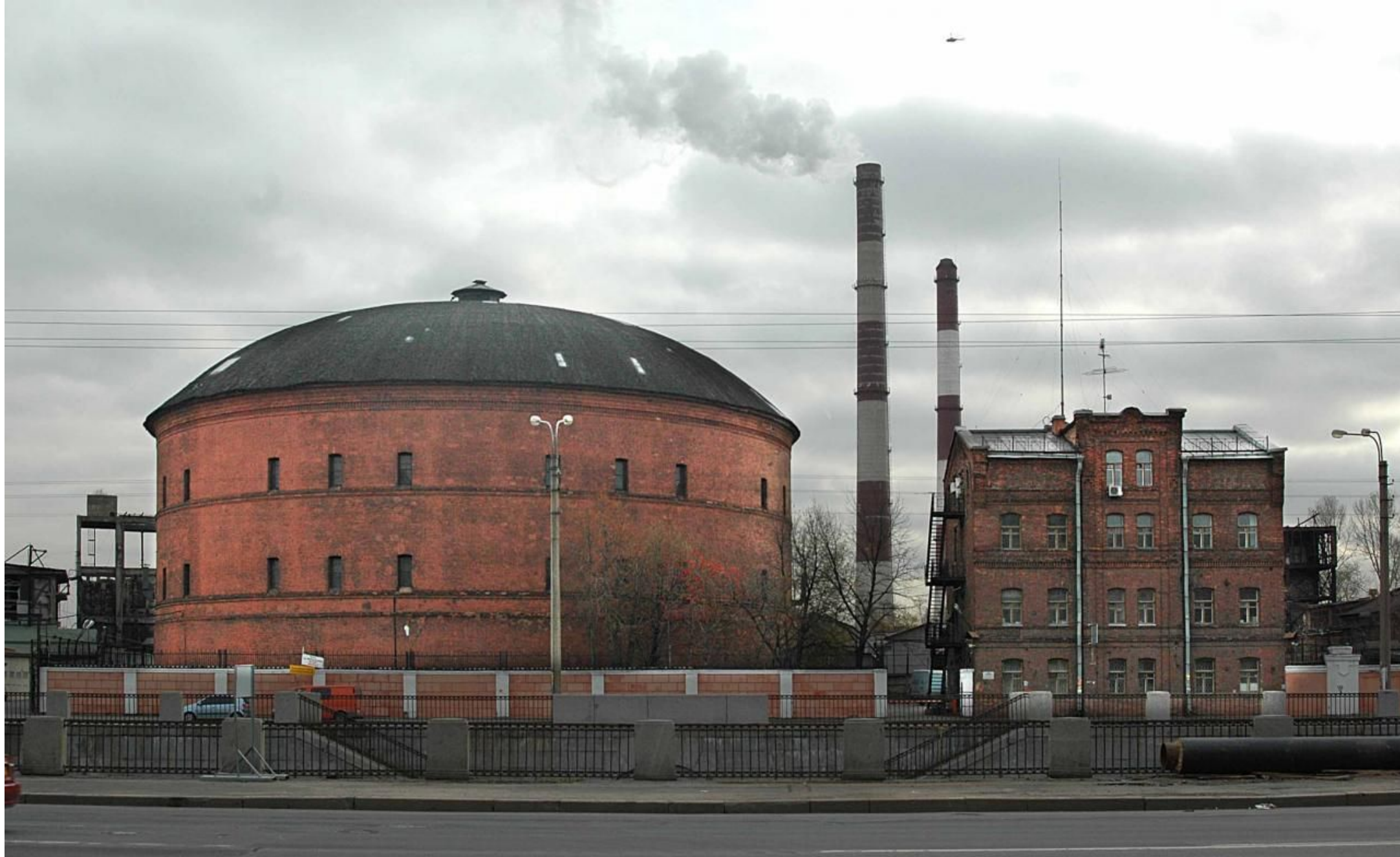
Газовое общество для освещения . Газгольдер