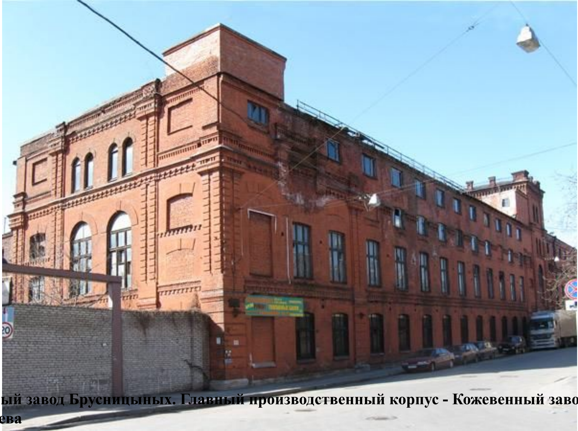
Кожевенный завод Брусницыных. Главный производственный корпус - Кожевенный завод им. А. Н. Радищева