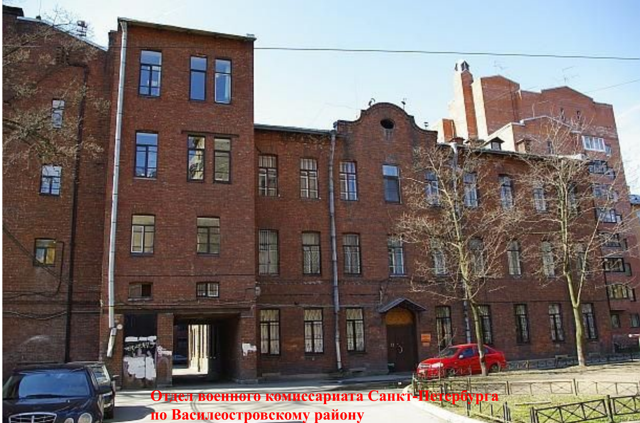
Отдел военного комиссариата Санкт-Петербурга по Василеостровскому району