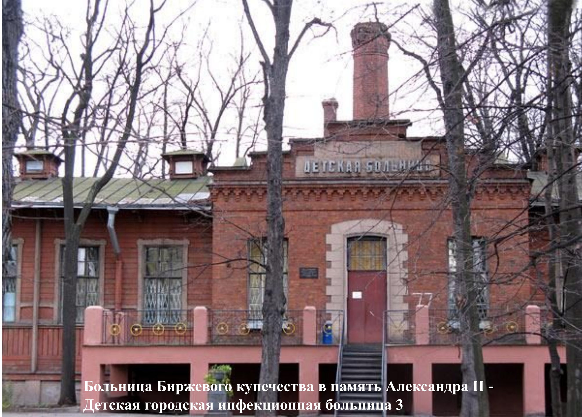
Больница Биржевого купечества в память Александра II - Детская городская инфекционная больница 3