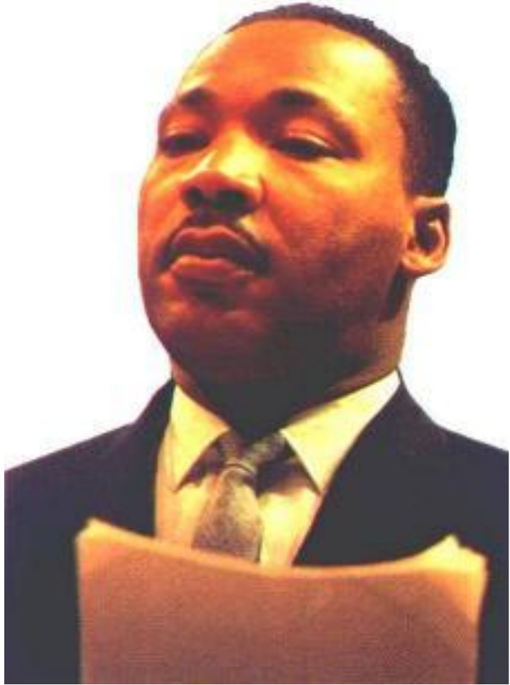
Мартин Лютер Кинг

В 1964 г. Кинг получил Нобелевскую премию Мира, но в 1968 г. был застрелен расистом.