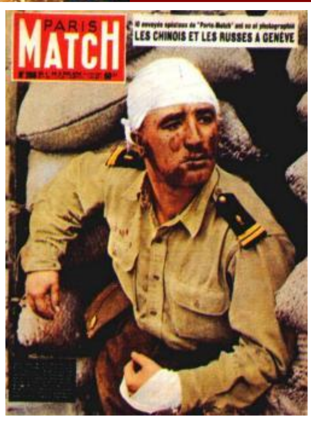
Советский солдат в Северном Вьетнаме

В январе 1973 г. был подписан Парижский договор. США выводили свои войска, а ДРВ обязалась прекратить поставки оружия на Юг.