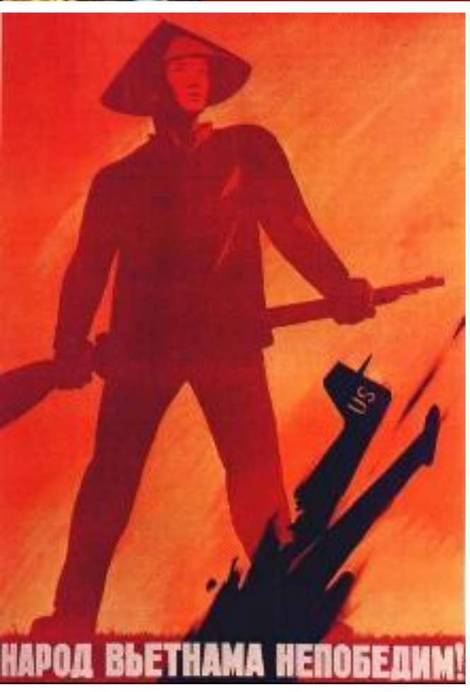
Плакат сер.70-х гг.

Крестьяне по всей стране поддерживали коммунистов. Те направляли по «тропе Хо Ши Мина» - дороге проложенной в джунглях через территорию Лаоса и Камбоджи- оружие и добровольцев на юг.