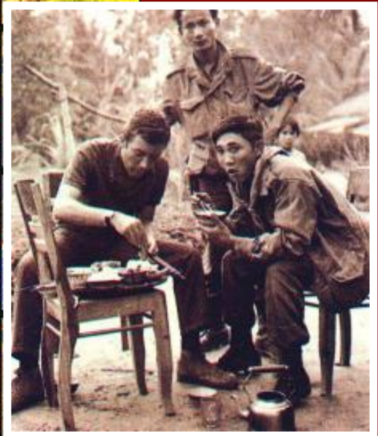
«Янки» и сайгоновцы.