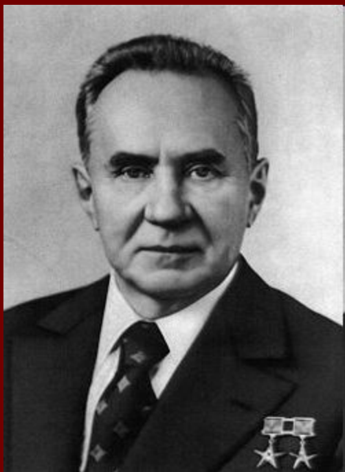
А.Н. Косыгин (1904-1980)