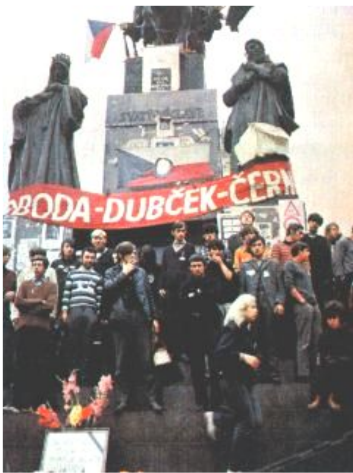
Митинг противников социализма.

Это могло привести к приходу к власти радикальных реформаторов.