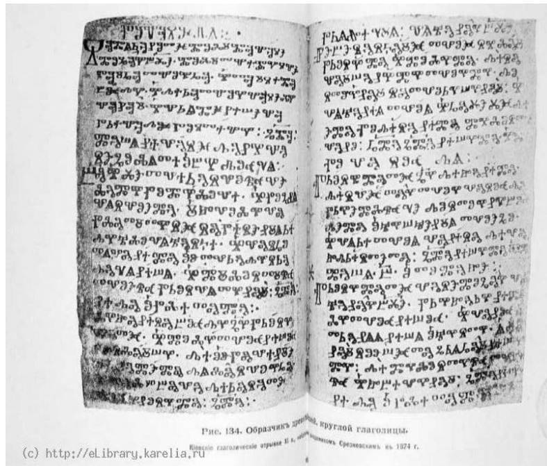
Рис. 134. Образцы древней круглой глаголицы.