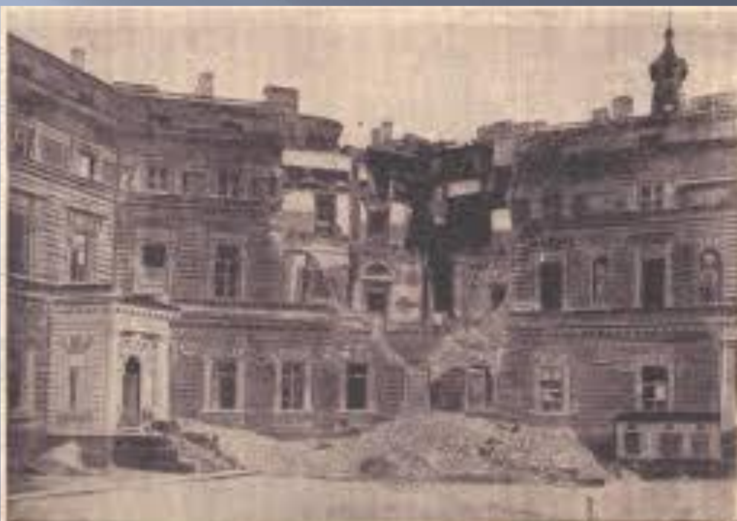
Шахновский дворец, разрушенный 4 апреля 1942 г. фугасной бомбой