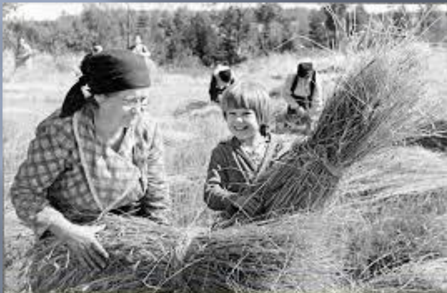
Первая уборка урожая в колхозе. Шестидесятилетняя пенсионерка и ее внуки, 1941.