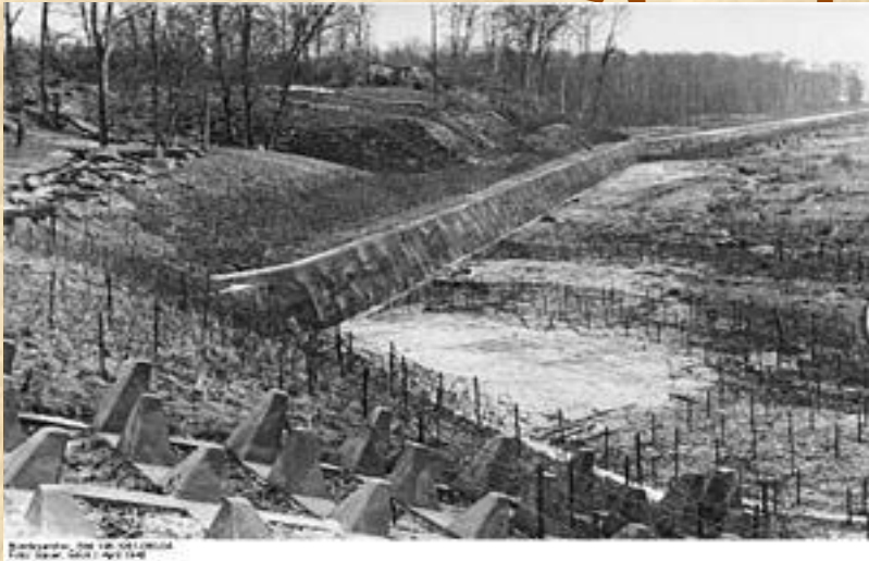
St. Eri line, 1944