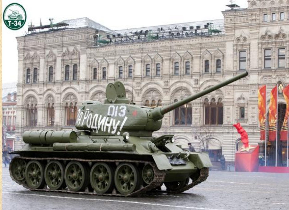
Москва, Красная площадь, 7 ноября 2009 года