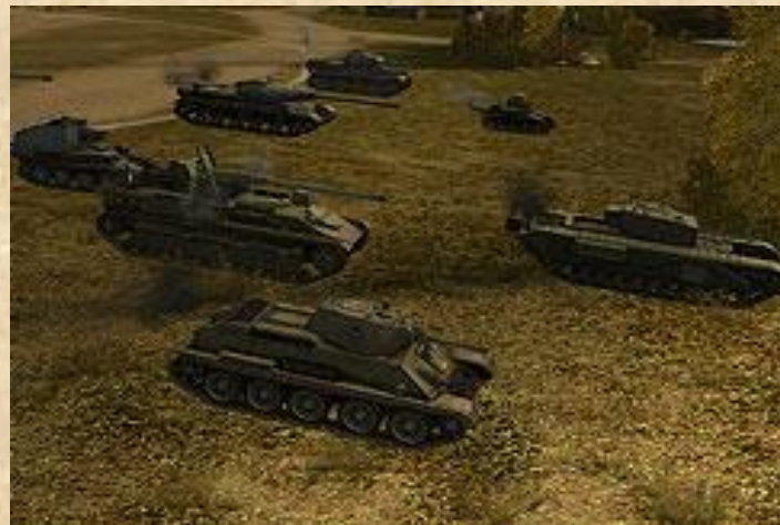
Огромный парк танков