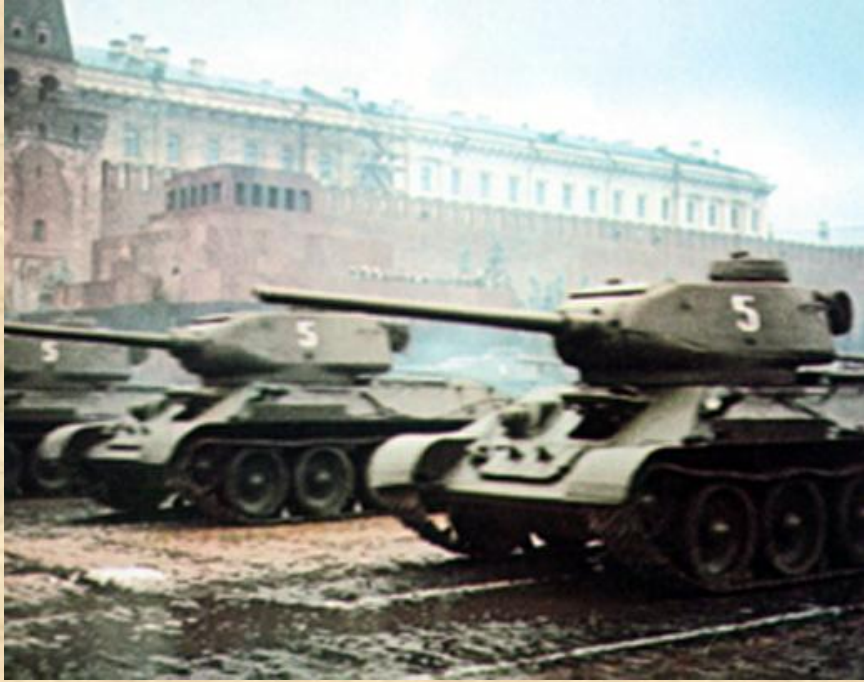
Танки Т-34 на Параде Победы. Москва, Красная площадь, 24 июня 1945