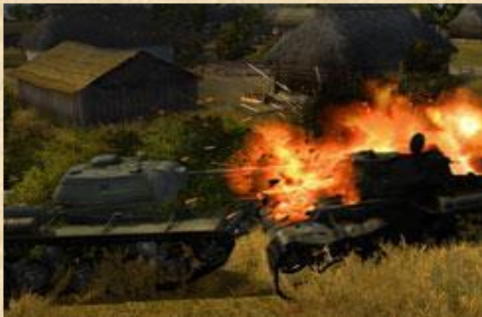
Убойная атмосфера танковых баталий