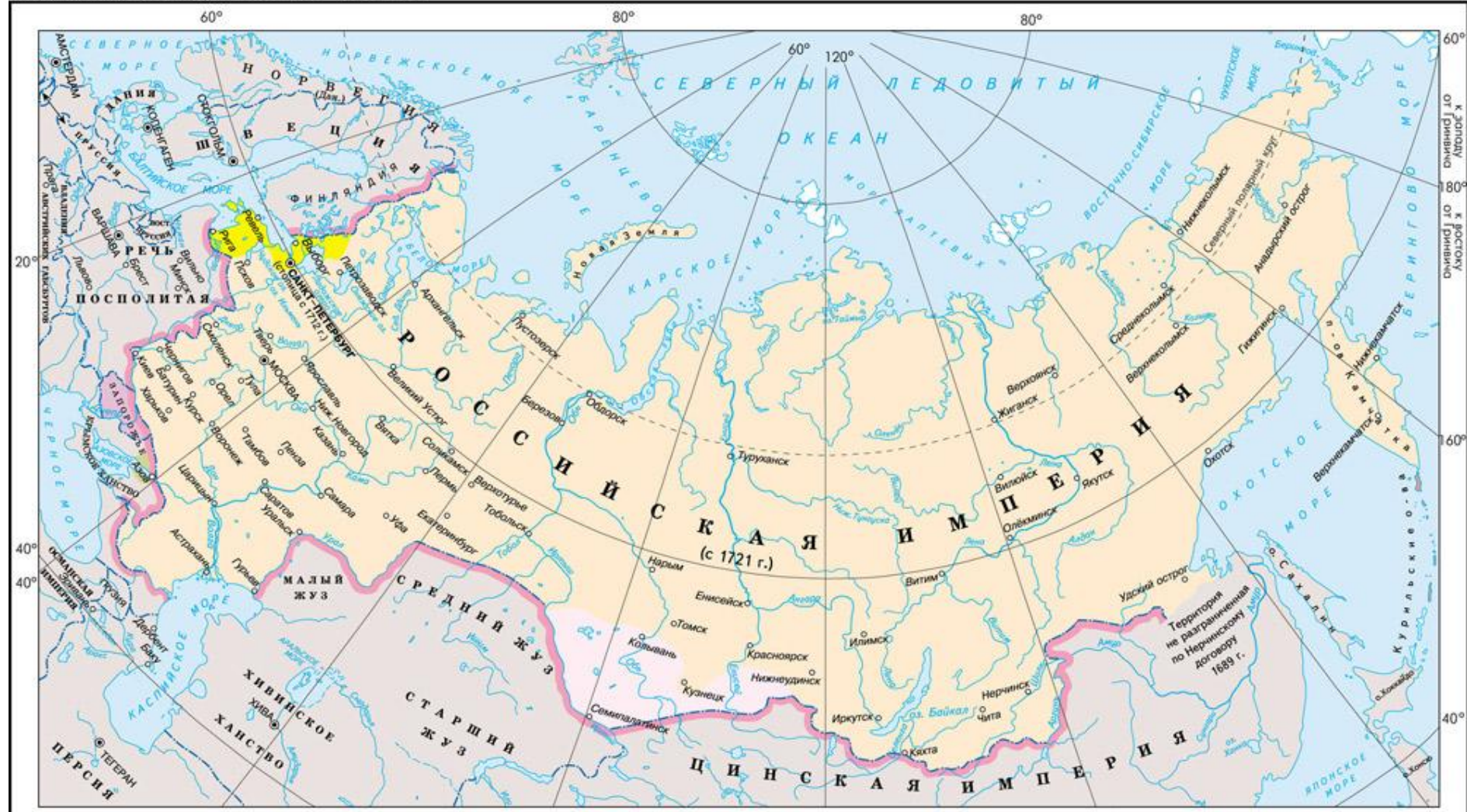
Российское государство в 1689–1721 гг.