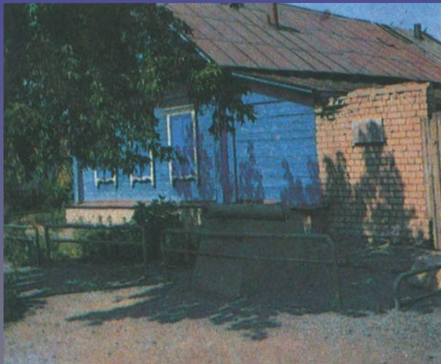
Оренбург. Слобода Берда. На этом месте стоял дом казака Ситникова, где жил Пугачёв. Об этом извещает надпись, укрепленная на кирпичной стене. Перед ней – пушка пугачёвской эпохи

«В Берде Пугачёв жил в доме Константина Ситникова», - записал Пушкин в своей дорожной книжке, посетив это место.