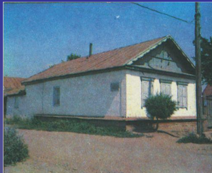
Оренбург. Слобода Берда. Дом И.Л.Бунтовой

Впечатления, почерпнутые при посещении пугачёвской резиденции, обогатили воображение поэта. Приметы обстановки, создающие реальность картин в «Капитанской дочке», были взяты Пушкиным во время знакомства с Бердами, Оренбургом и его окрестностями. ,без знания таких «примет» художник не чувствует себя свободным, рисуя картины жизни.