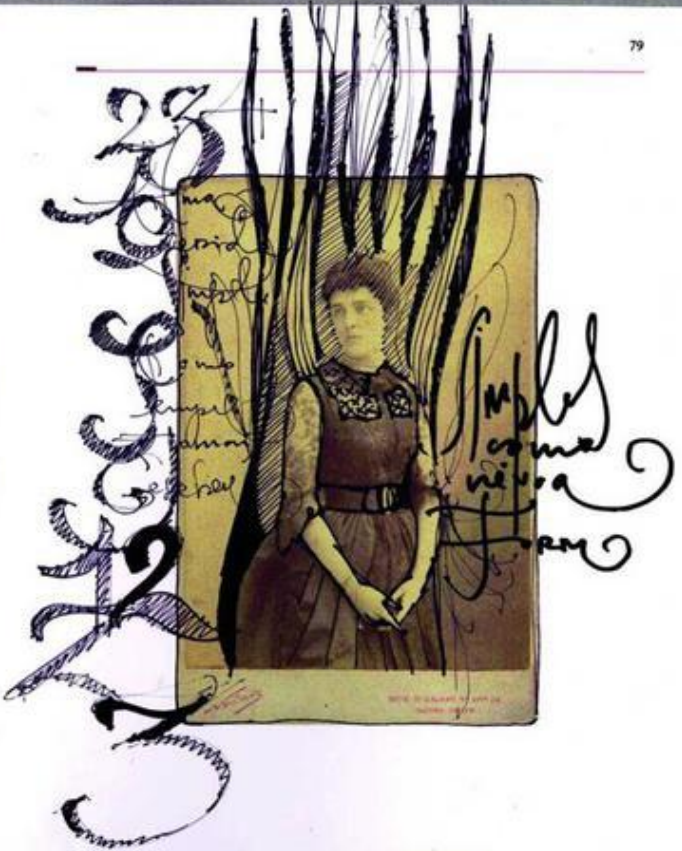
LADY RANDOLPH CHURCHILL (1854-1941)