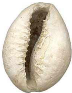
Раковина Каури

за подкову — 1 рыба; за пару женских башмаков — 3 рыбины; за бочонок вина — 100 рыбин; за бочонок сливочного масла — 120 рыбин.