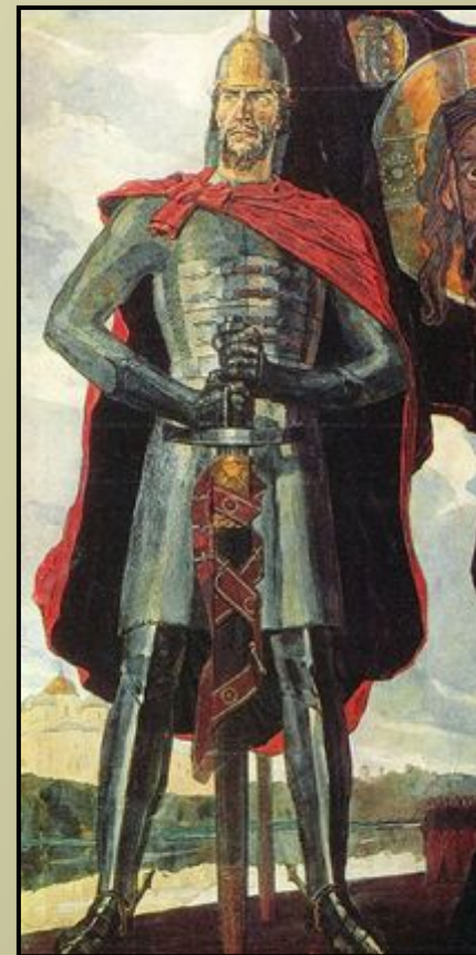
Павел Корин «Александр Невский»