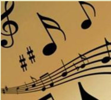
Таблица к уроку «Виды искусства»