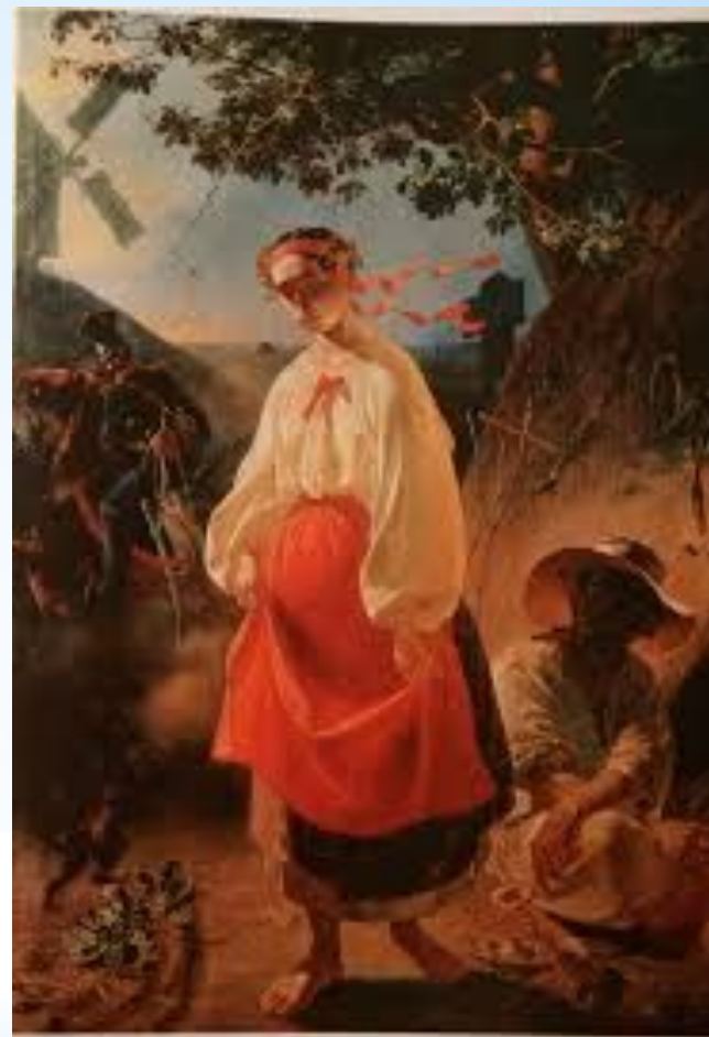
«Катерина» 1842 р