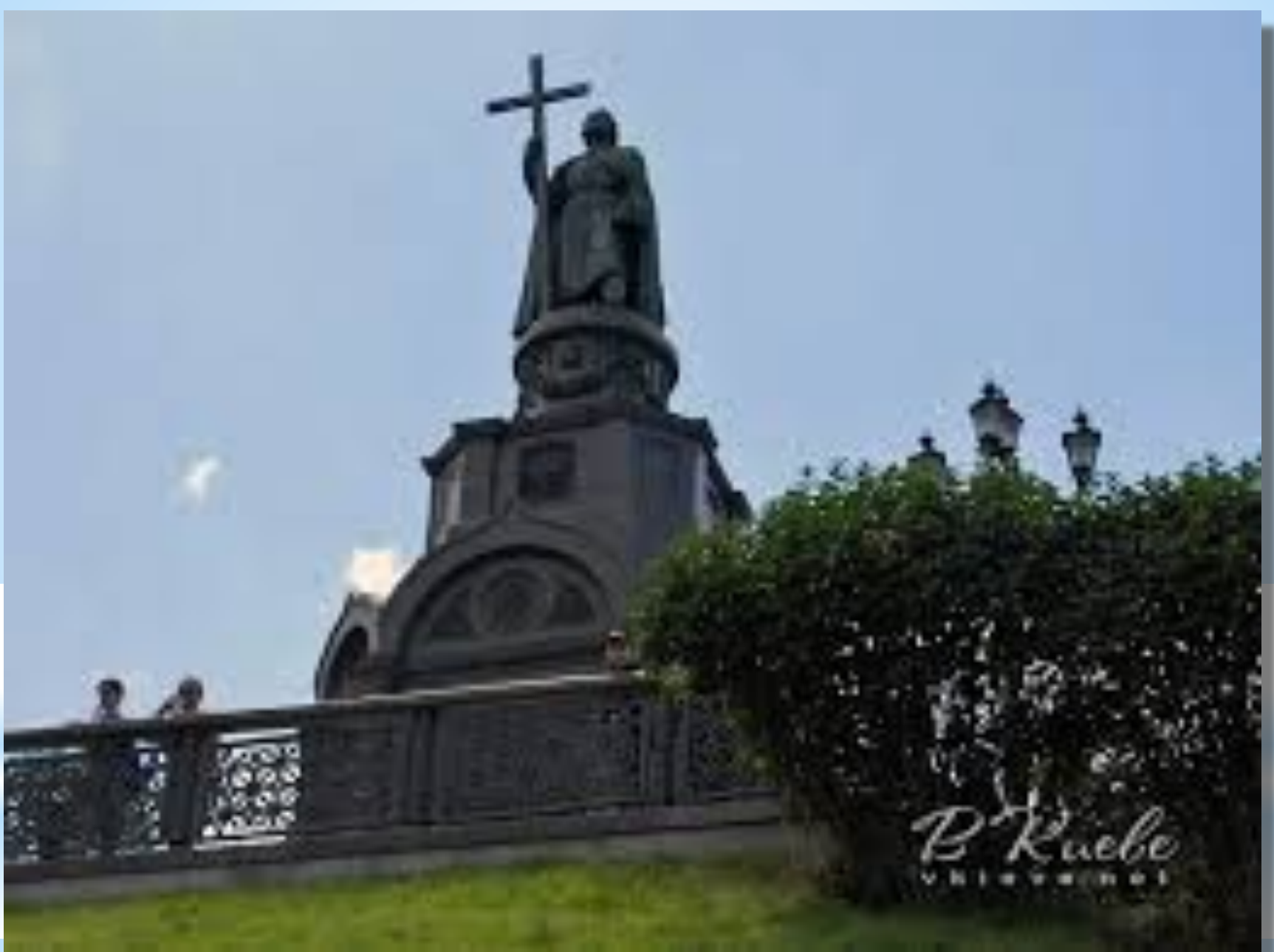
Пам'ятник князю Володиміру