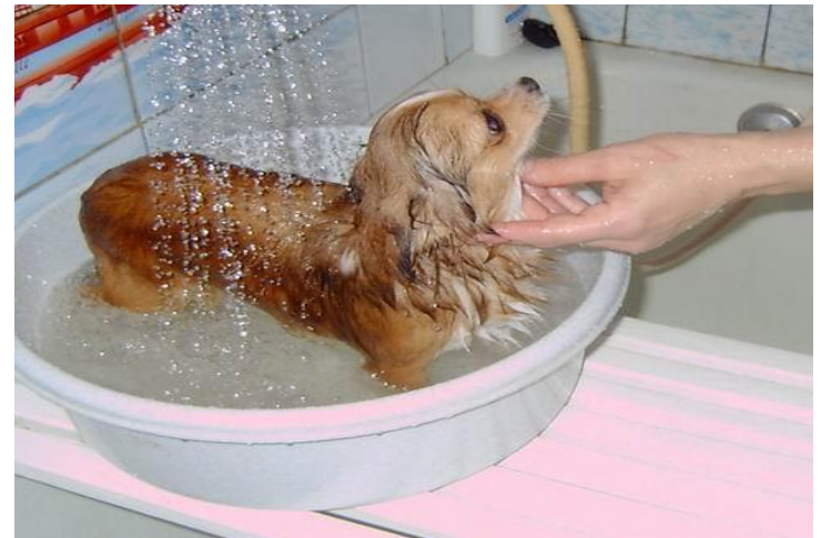
Рисунок 3 – мытье собаки