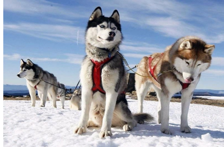
Рисунок 7 - Сибирский хаски