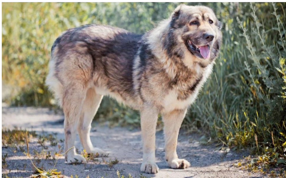
Рисунок 6 -Кавказская овчарка