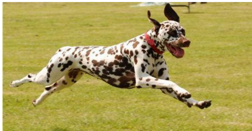
Рисунок 1 – активная собака

Если потребитель приобретет собаку с очень высоким уровнем активности и не сможете его удовлетворить, то у собаки могут возникнуть проблемы поведения, что может принести немало проблем.