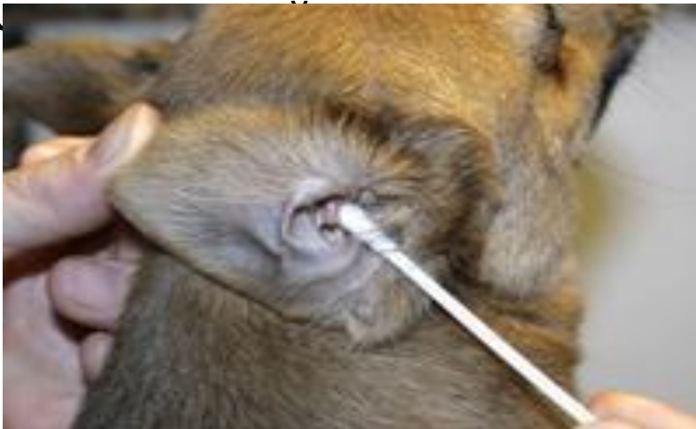
Рисунок 2 – чистка ушей собаки

Собаки с длинными ушами чаще подвержены инфекции уха, а это значит, что они нуждаются в регулярной