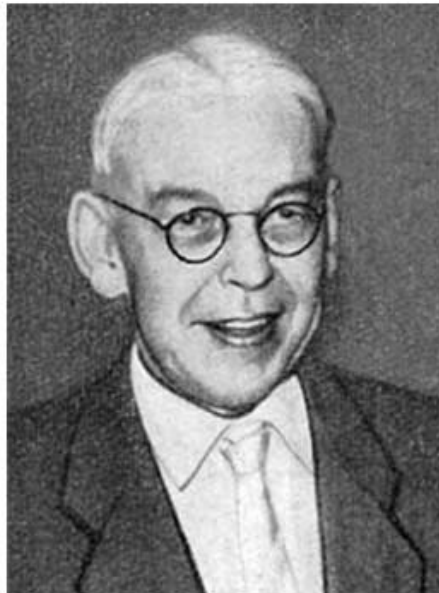
Теплов Борис Михайлович

– это совокупность свойств, характеризующих динамические особенности протекания психических процессов и поведения человека, их силу, скорость, возникновение, прекращение и изменение (Б.М. Теплов)