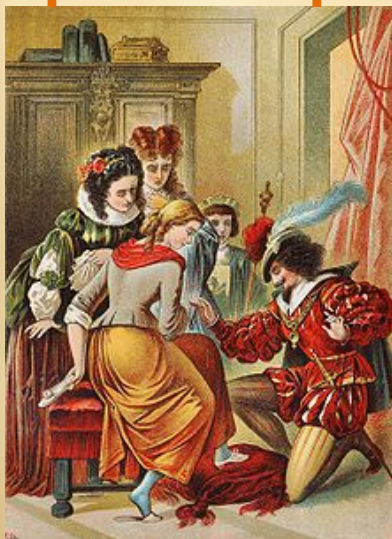
Золушка примеряет туфельки. Немецкая иллюстрация XIX века

Западноевропейская сказка, наиболее известная по редакциям Шарля Перро, братьев Гримм и Джамбаттисты Базиле. Это один из популярнейших «бродячих сюжетов», который имеет свыше тысячи воплощений в фольклоре разных народов мира