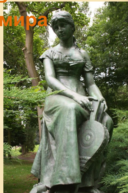
Памятник Золушке в городе Брюссель