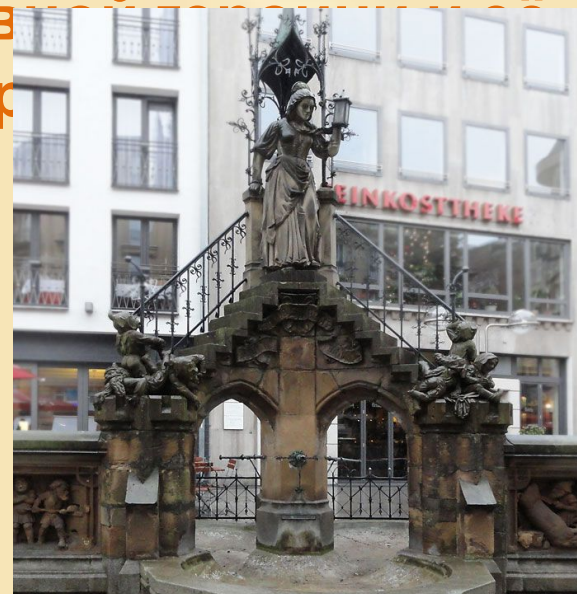
Памятник в городе Кельн