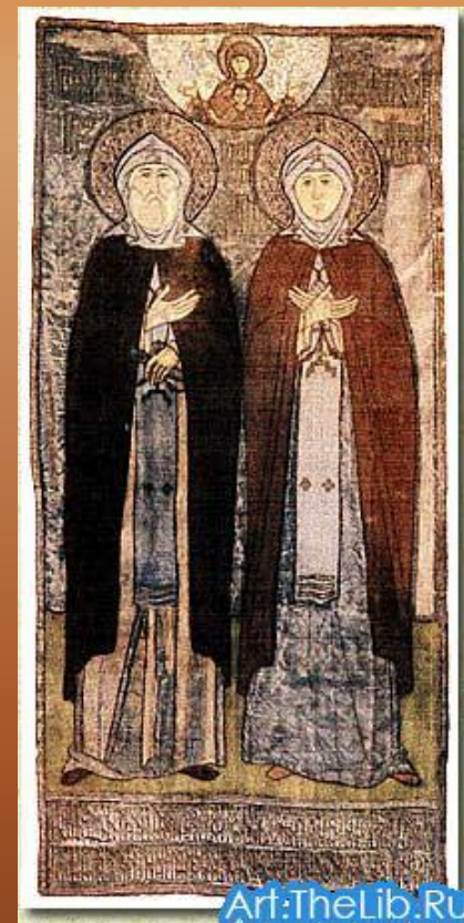
Art:TheLib.Ru Свв. Петр и Феврония Муромские. Покров на раку с мощами. XVI век

В это время митрополит собирал по русским городам предания о праведных людях, которые прославились своими поступками (и которые позже были причислены к лику святых).