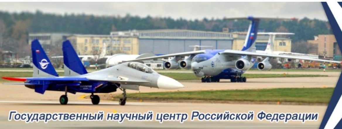
Государственный научный центр Российской Федерации