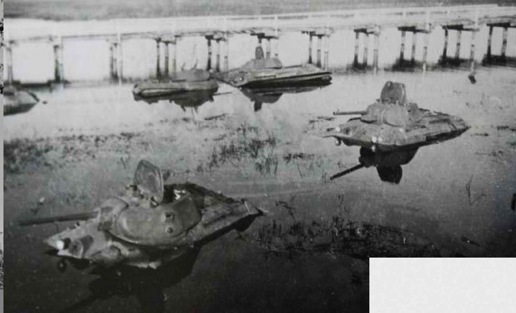
Враги и союзники Т-34