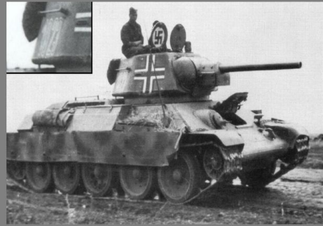
На корпусе или башню трофейных Т-34 немцы наносили опознавательные знаки или