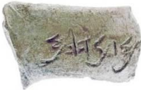
финикийские глиняные черепки