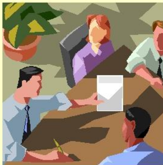
Письменная и устная