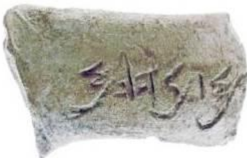
финикийские глиняные черепки