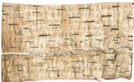
письмо на бересте