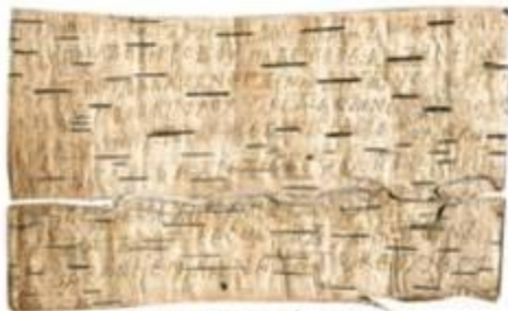
письмо на бересте