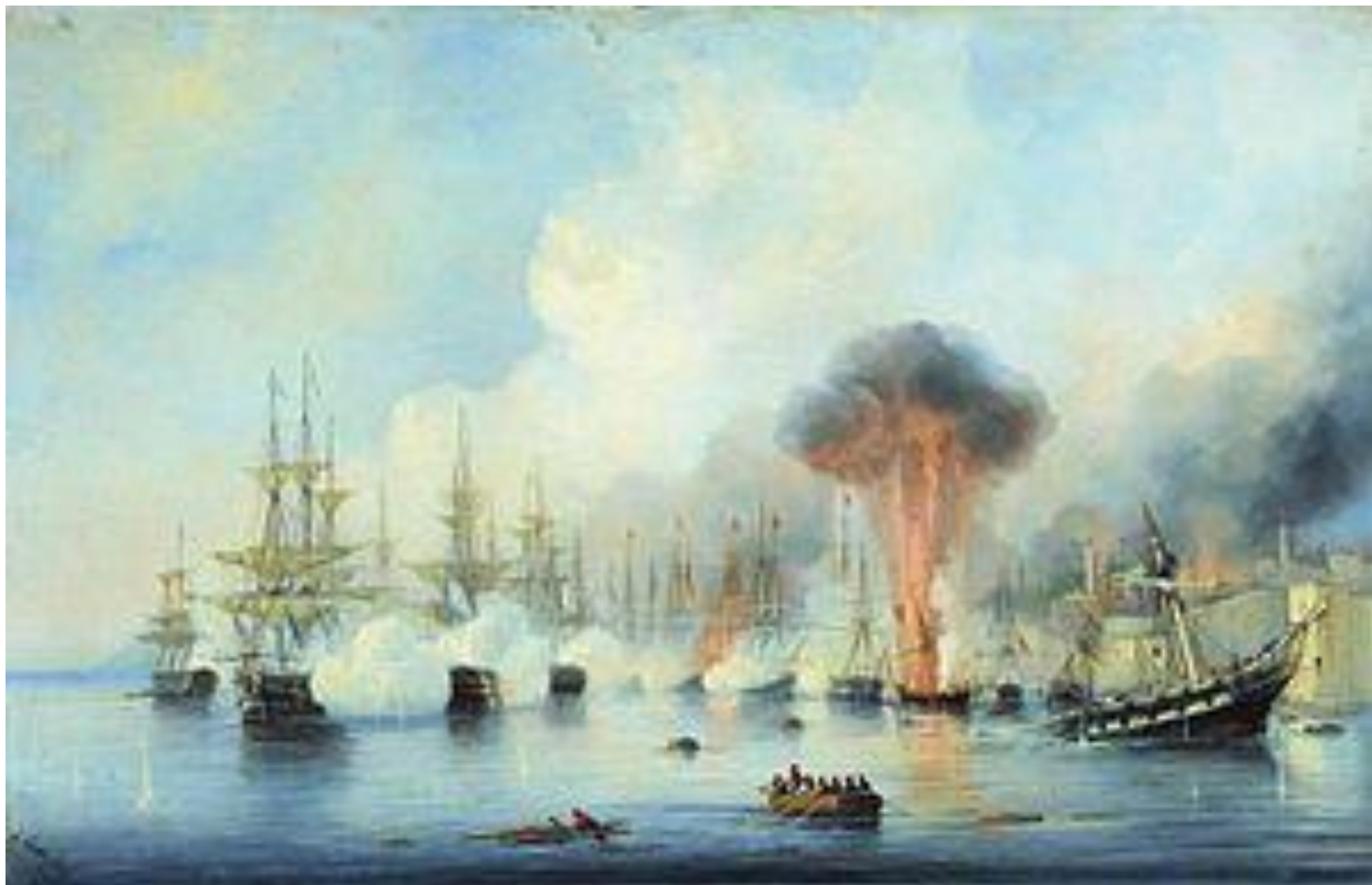
Синопский бой. Картина А. Боголюбова.