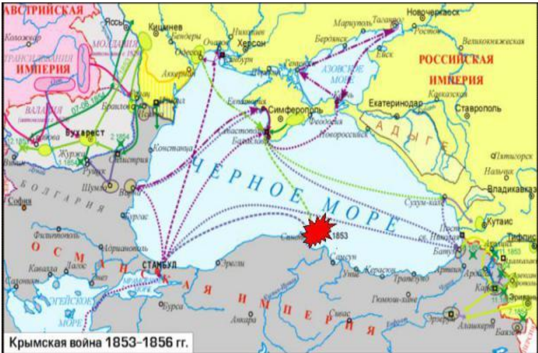
Крымская война 1853-1856 гг.