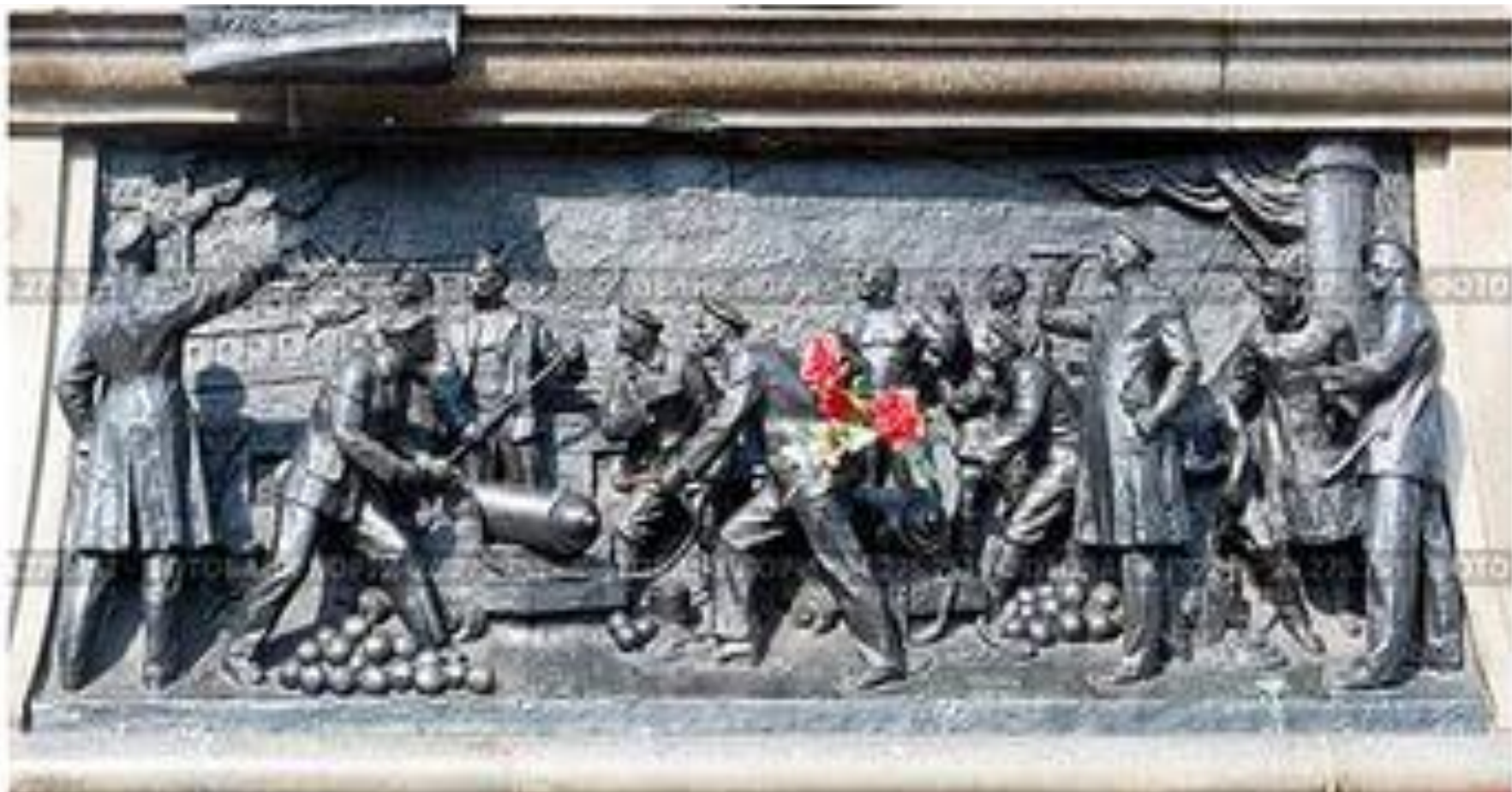
Горельеф «Синопское сражение» на постаменте памятника П. Нахимову в Севастополе