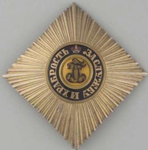
Звезда Кресту Св. Георгия