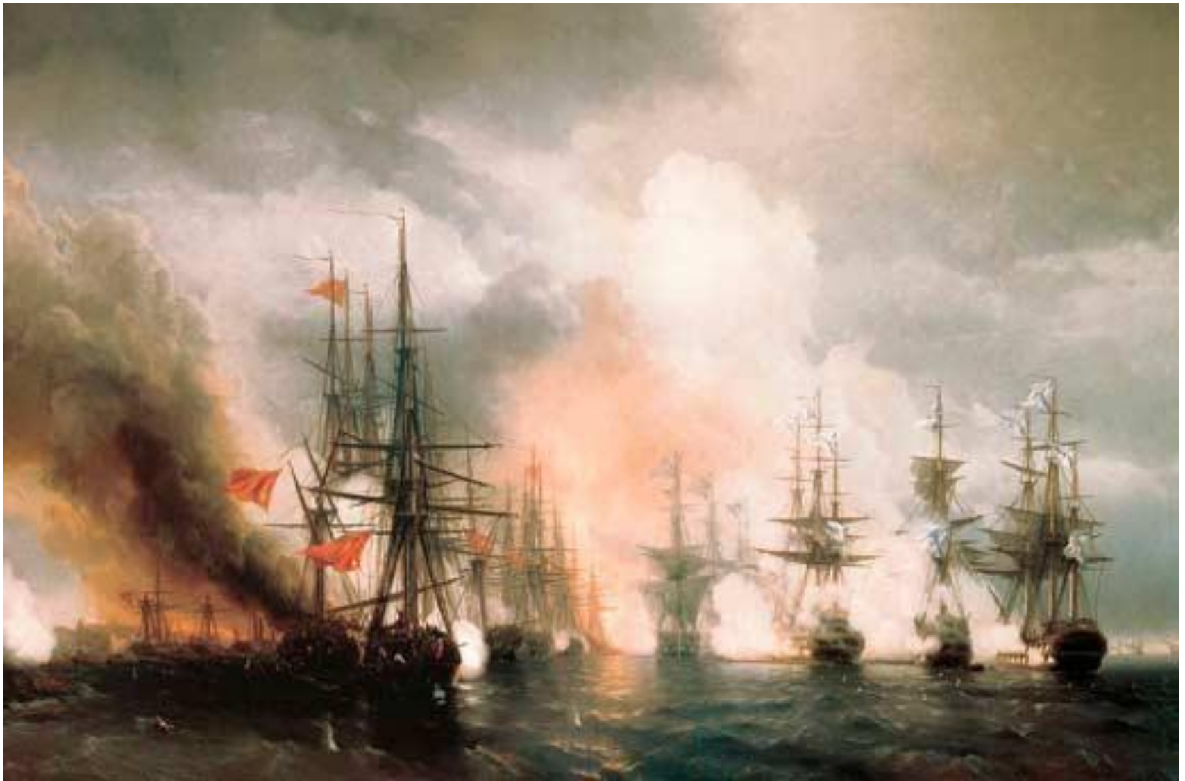
Синопское сражение. Картина И. Айвазовского.