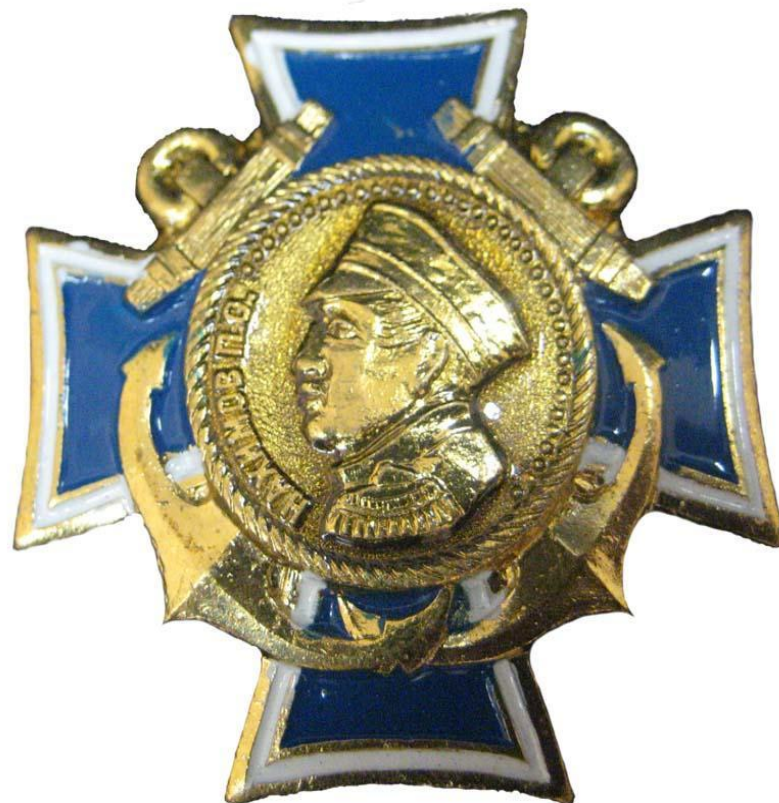
Ордена Нахимова. Учреждены в 1944 году