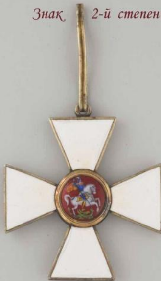
Знак 2-й степени