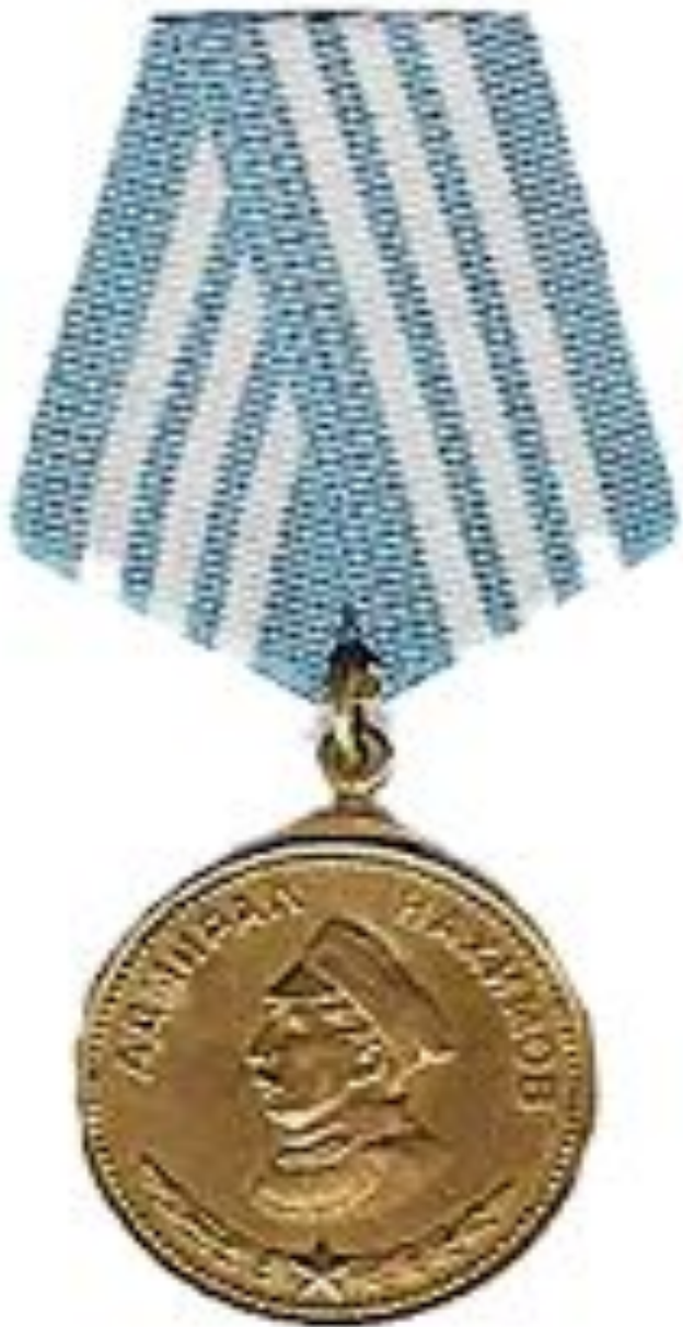
Медаль Нахимова. Учреждена в 1944 году