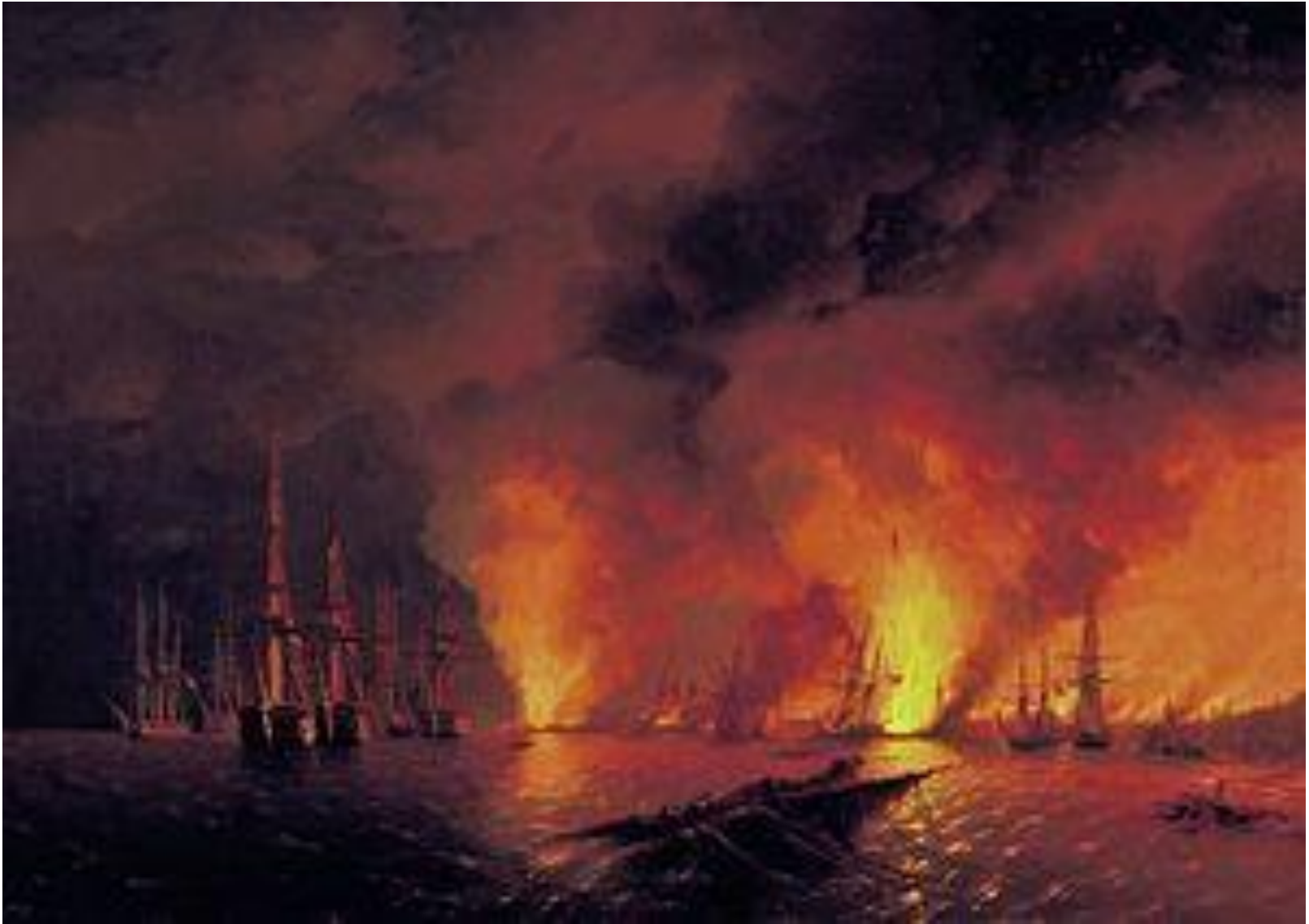
Ночь после боя. Картина И. Айвазовского.