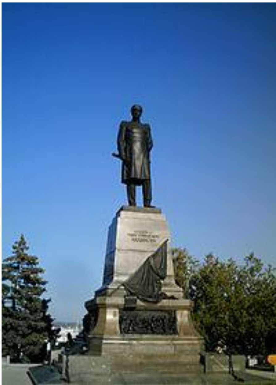
Памятник П. Нахимову в Севастополе