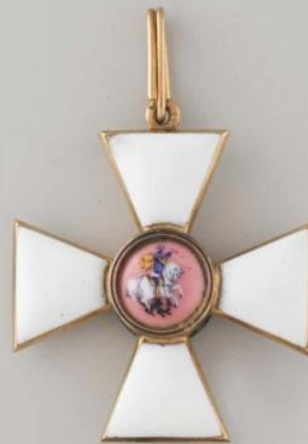
Знак 3-й степени