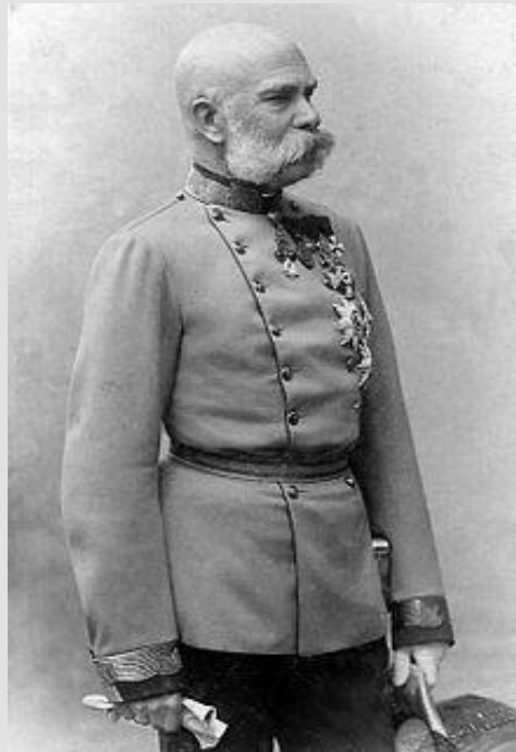
FRANZ JOSEPH I