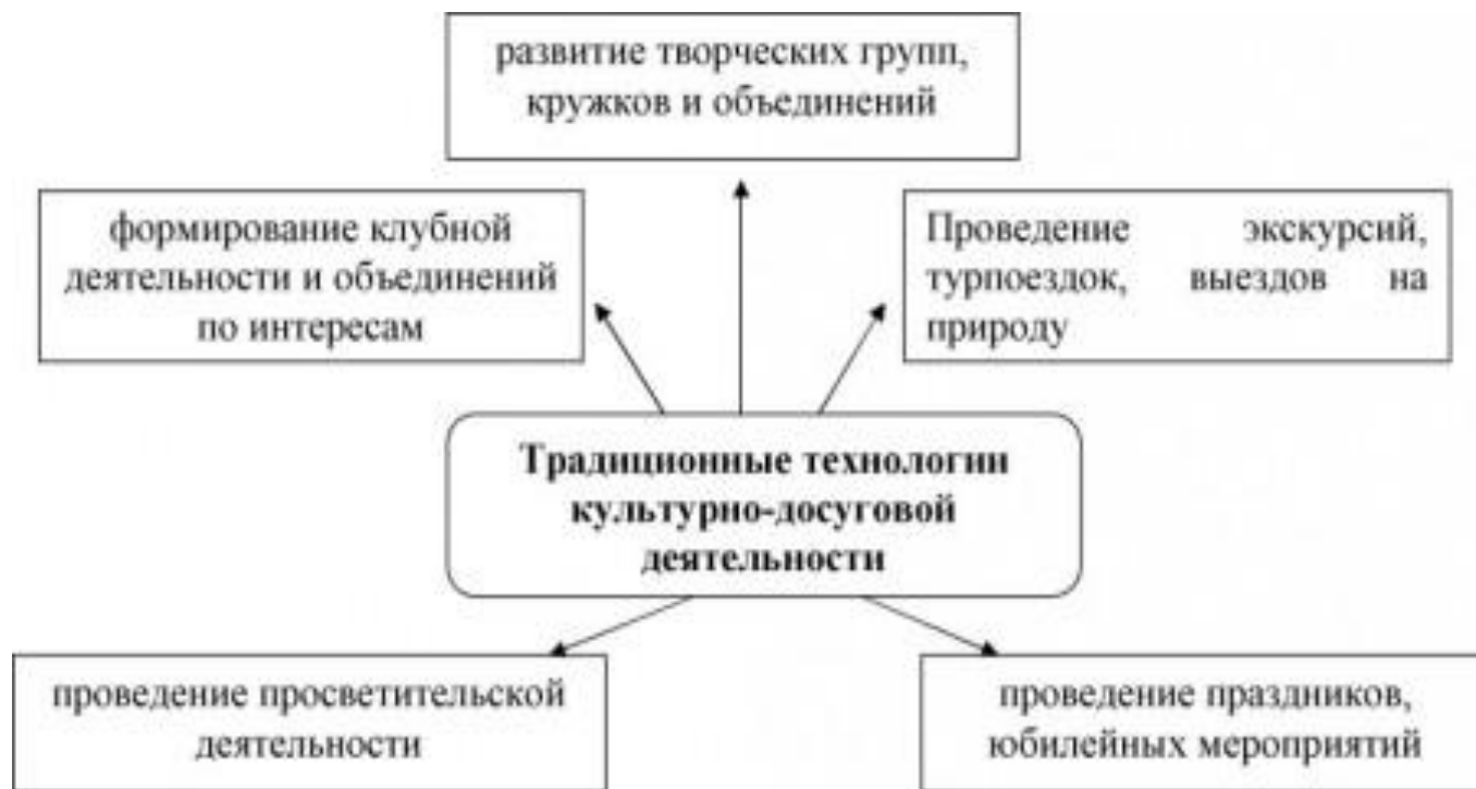
Рис.22.2 – Традиционные технологии культурно-досуговой деятельности

Задание. Рассмотрите схему традиционных технологий СКД Определите их взаимосвязь