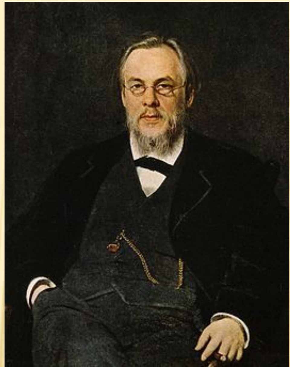
БОТКИН С.П. - РУССКИЙ ВРАЧ-ТЕРАПЕВТ И ОБЩЕСТВЕННЫЙ ДЕЯТЕЛЬ

Например, Сергей Петрович Боткин называл кумыс «прекрасным средством» и считал, что приготовление этого напитка должно стать общим достоянием, как приготовление творога или простокваши