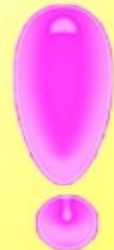
Фото работы отправь учителю.