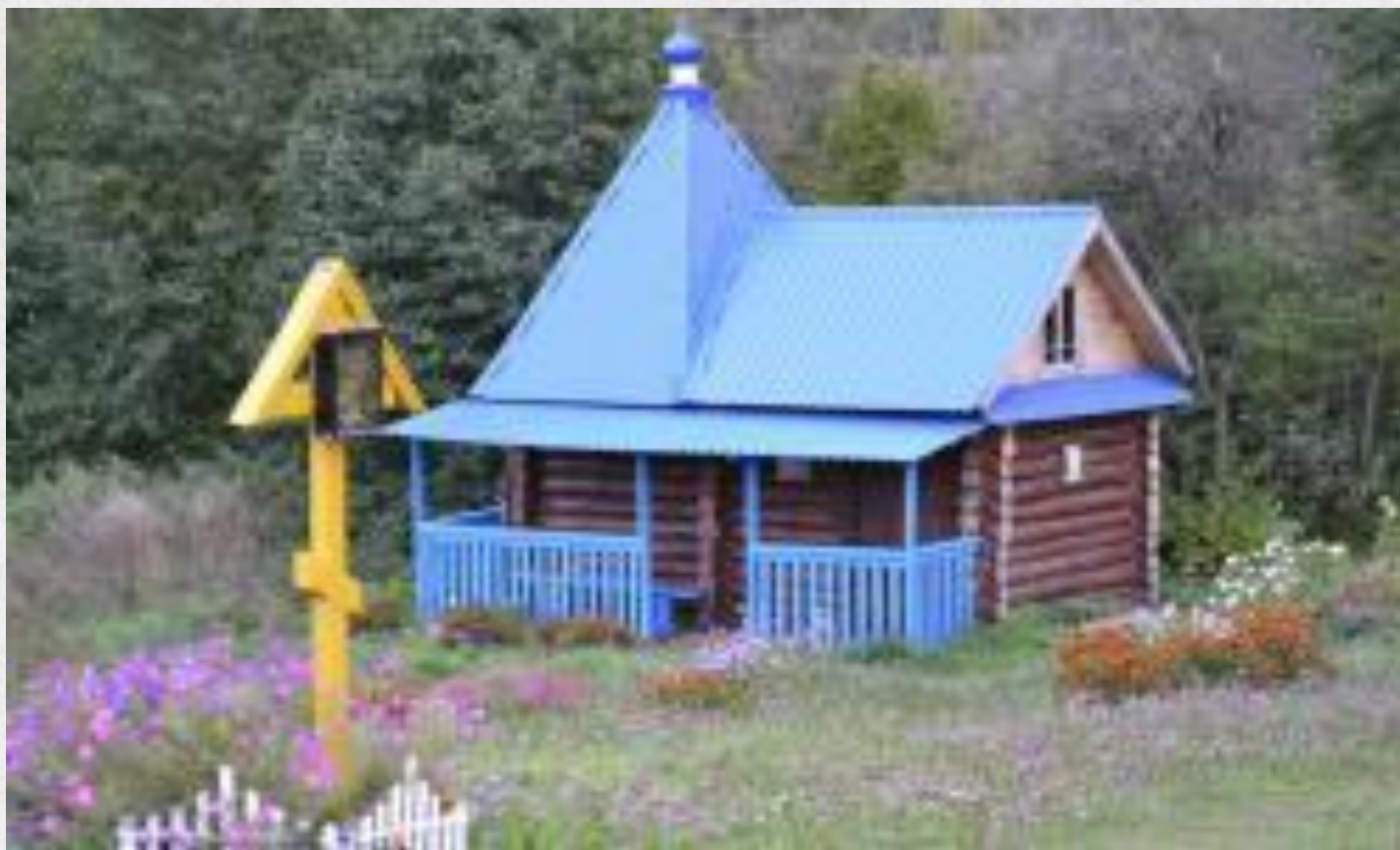
Купель на святом источнике.