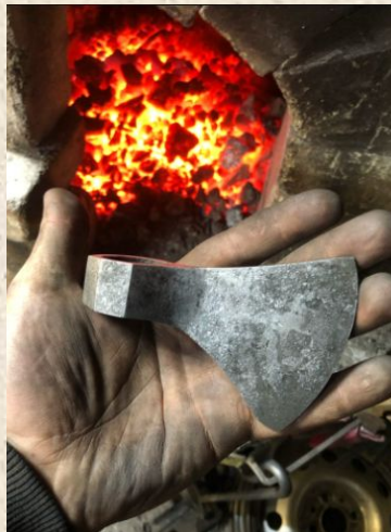
Версия топора того времени

Нижегородцы занимались металлообработкой, бортничеством, изготовлением одежды и обуви; развивалось речное судостроение.