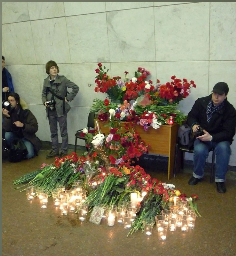
«Памятник на станции «Лубянка»

В результате взрывов погиб 41 и ранены 88 человек. Среди пострадавших были граждане России, Таджикистана, Киргизии, Филиппин, Израиля и Малайзии