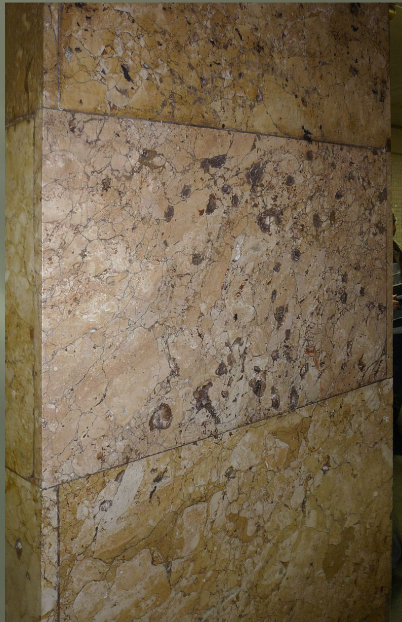
Колонна, повреждённая взрывом на станции «Парк культуры».

По результатам взрывотехнической экспертизы, проведённой специалистами Федеральной службы безопасности, мощность взрывного устройства, сработавшего на станции «Лубянка», составила до 4 килограммов в тротиловом эквиваленте, а на станции «Парк культуры» – от 1,5 до 2 кг в тротиловом эквиваленте.