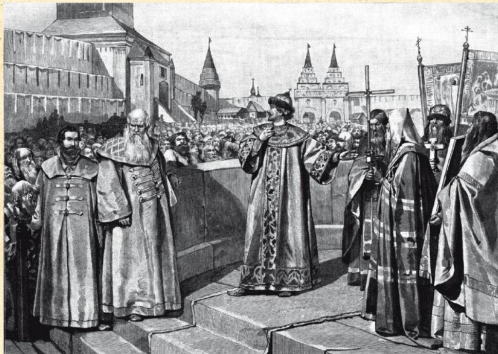
рисунок русского художника К. Лебедева «Царь Иоанн IV открывает первый Земский собор своею покаянною речью».