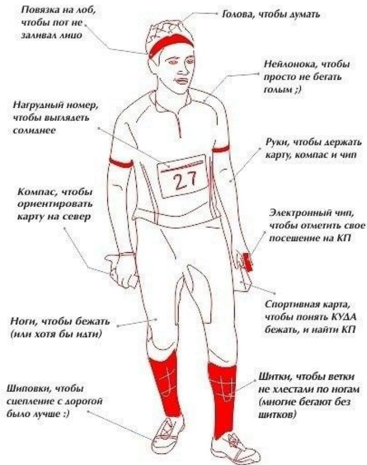
Обычный ориентировщик в полной спортивной амуниции