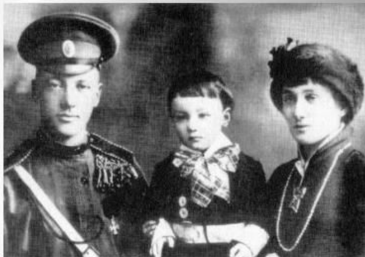
Николай Гумилев и Анна Ахматова с сыном Львом

В 1912 года у них родился сын, которому дали имя Лев.