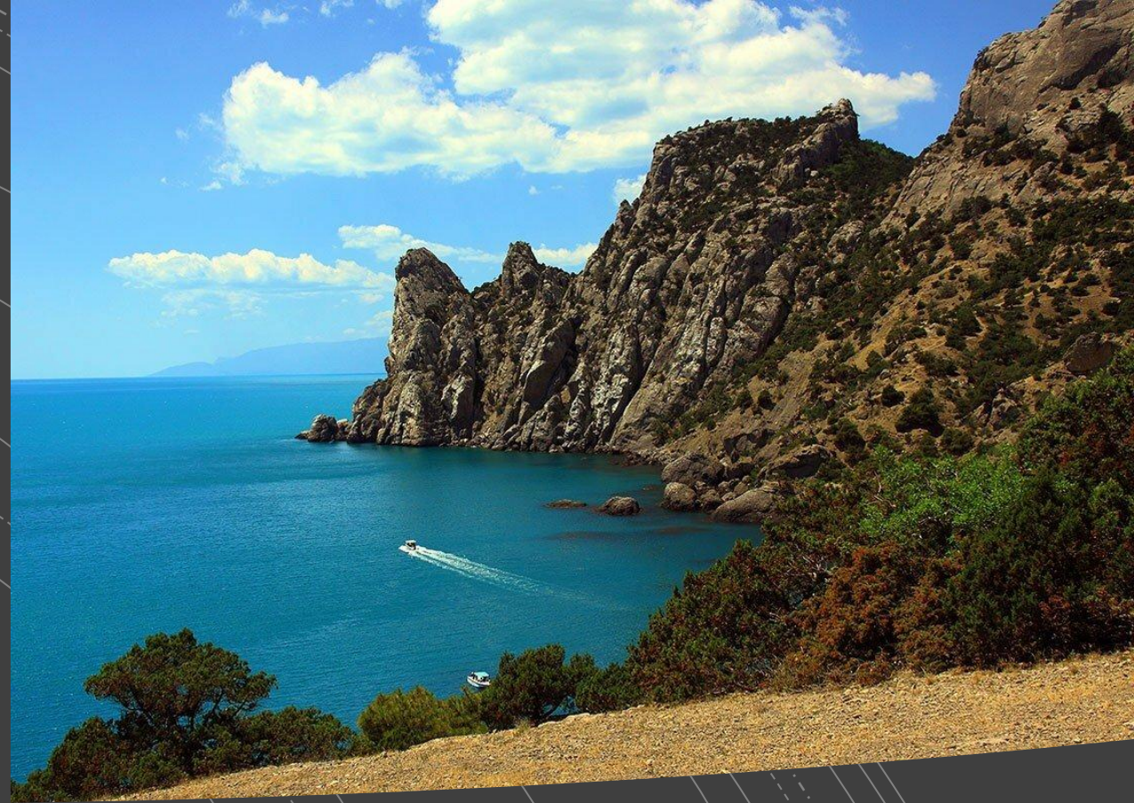
Иван Алексеевич Бунин