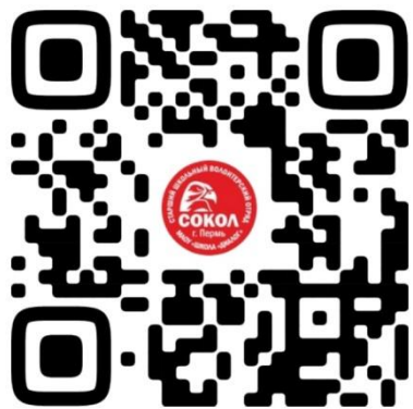
Наша группа VK