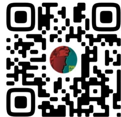
Районный исторический квест