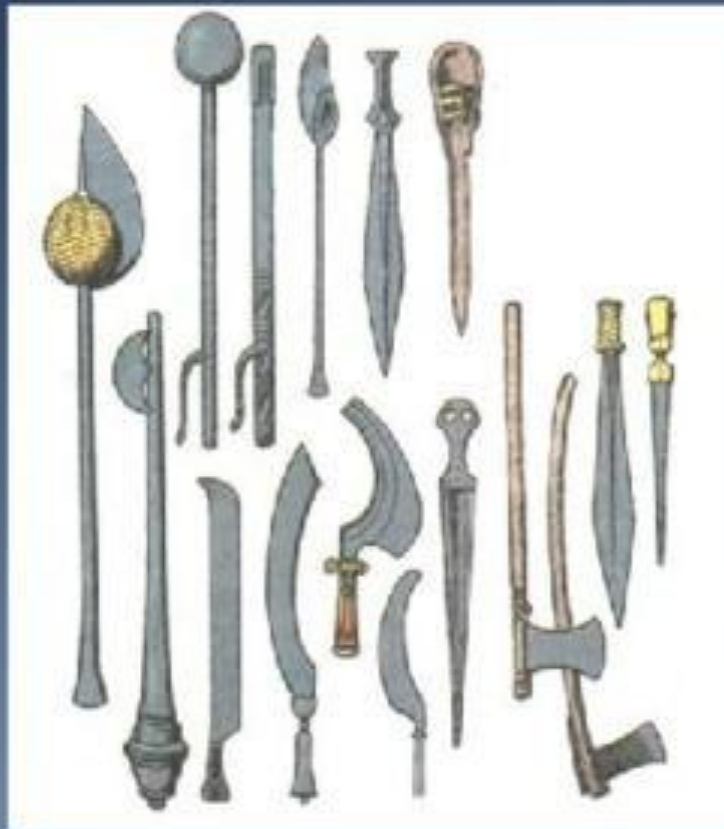
Булавы, сабли, боевые серпы, топоры, кинжалы